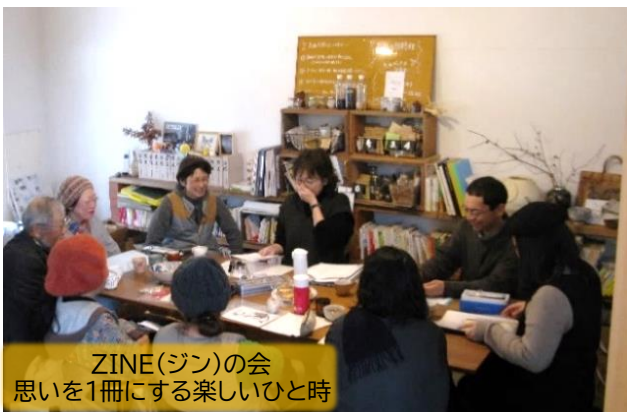
ZINE(ジン)の会 思いを1冊にする楽しいひと時