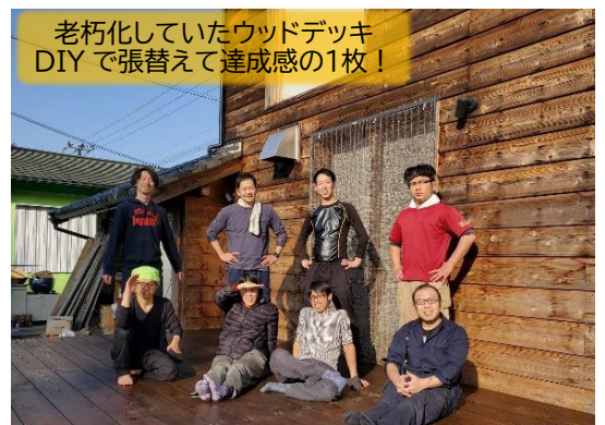
老朽化していたウッドデッキ DIYで張替えて達成感の1枚！

「やまんなか」が、より村民の皆様にとって近い存在になれると、なお一層嬉しく思います。