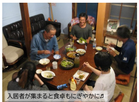
入居者が集まると食卓もにぎやかに♪

炊飯器も2台、シンクも2つあり、調理器具も多数揃っています。また複数人の共同生活となるので、洗濯機が2台と、冷蔵庫はなんと4台備えてあり、7~8月の猛暑の時でも滞在できるようにとの配慮が見られます。この日の夕食は、僕が取材に来るとの事でみんな一緒に食べる流れになってしまいましたが、それぞれ勤務時間も違いますし夜勤に入る場合もあるので、普段は各自で炊事・食事するのだそうです。そして時々「全員集合」する日を設けて、庭でバーベキューやたこ焼きパーティー