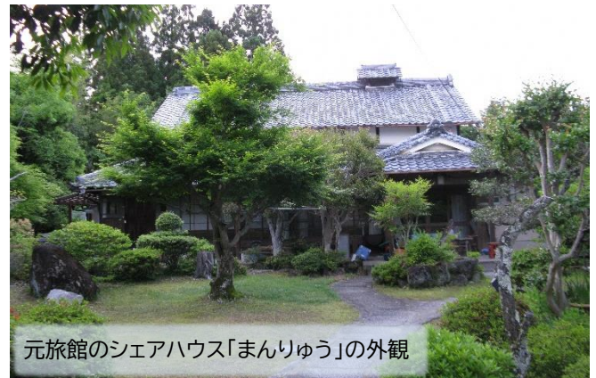
元旅館のシェアハウス「まんりゅう」の外観

今年もお茶の繁忙期がやってきましたね。田山地区にある移住交流スペース「やまんなか」にいと、刈り取った茶葉をてんこ盛りに積み込んだトラックが何台も通り過ぎていくのをよく見かけます。さて、今回の記事は南山城村ではなく、お隣の月ヶ瀬地区の事を書きたいと思います。というのも、毎年この時季に短期アルバイトのために「1~2ヶ月だけ借りられる物件はないか？」という問い合わせがあるのです。南山城村には残念ながらそういう物件