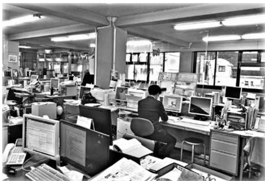
昼休みでも窓口対応（村役場）

この条例は、公布の日から施行する。ただし、第2条の規定は、令和3年4月1日から施行する。