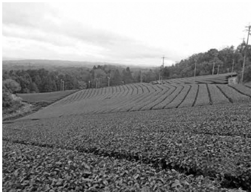
次期作につなぐ（高尾）