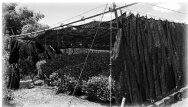
高品質茶に必要な被覆材