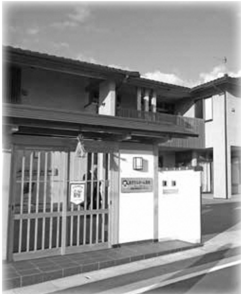
あすなろホーム山の辺(天理市)