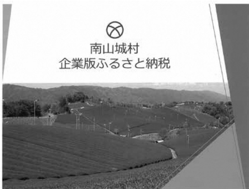
紹介用パンフレット

Q 企業版ふるさと納税の取り組みは。 A 村長 7月に「企業版ふるさと納税」を活用した「南山城村まち・ひと・しごと創生推進計画」と・しごと創生推進計画」