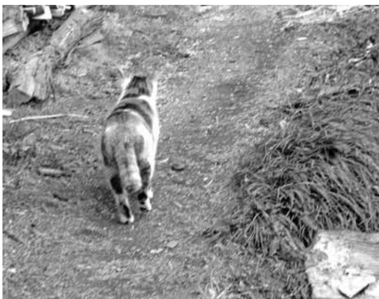
住民泣かせの野良猫

当村としても、避妊・去勢手術を行い、地域活動をする団体に対しての助成制度などを検討する。