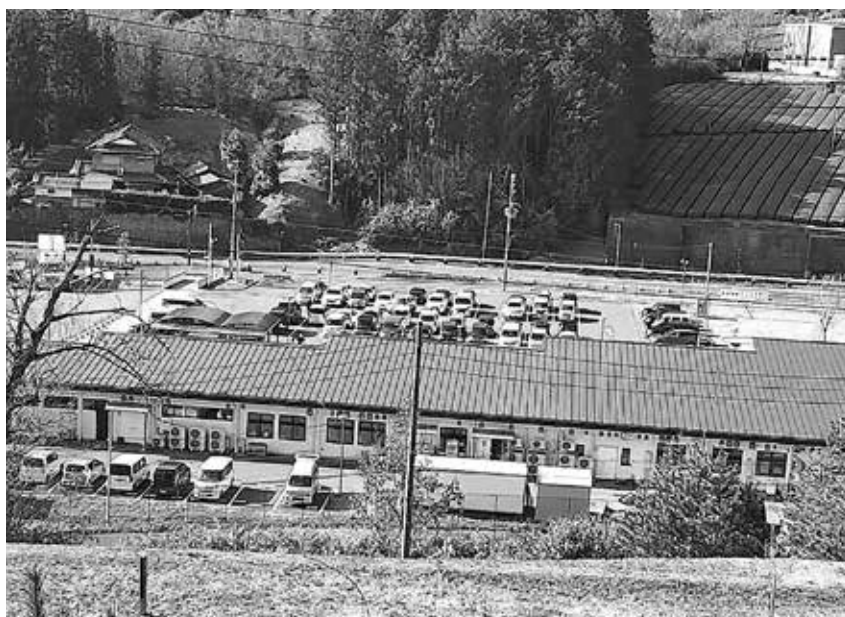
IoT情報が詰まった、道の駅

A 村長 ①ターゲット層を確立した商品開発や情報発信を行い、より戦略的な観光施策を立案。 ②令和2年度の保守契約金額は458万7千円。この金額は毎年度発生。