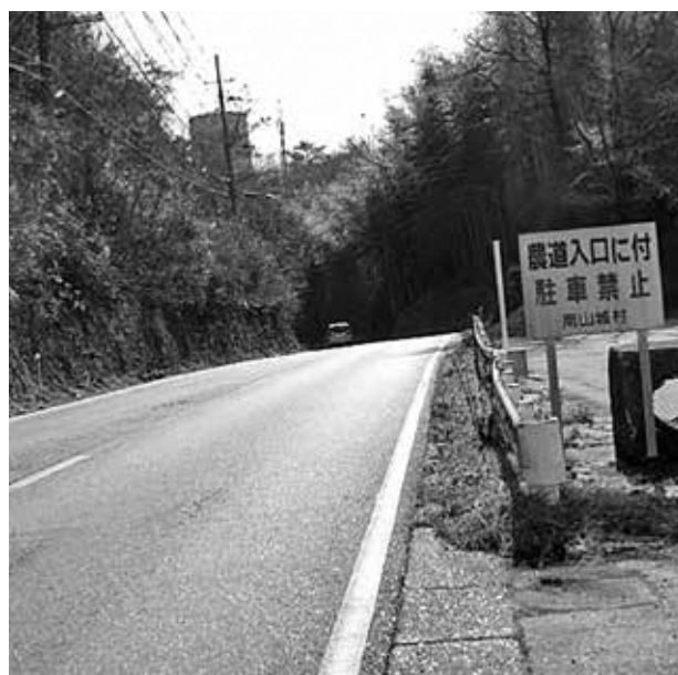
163号歩道設置予定（押原）

Q 国道163号線の押原くわいセンターの歩道は長年の願いだ。府との交渉で実施すると聞いているがどうか。 A 村長 府の事業で年度内に着手と聞いている。くわいセンター側につける予定である。