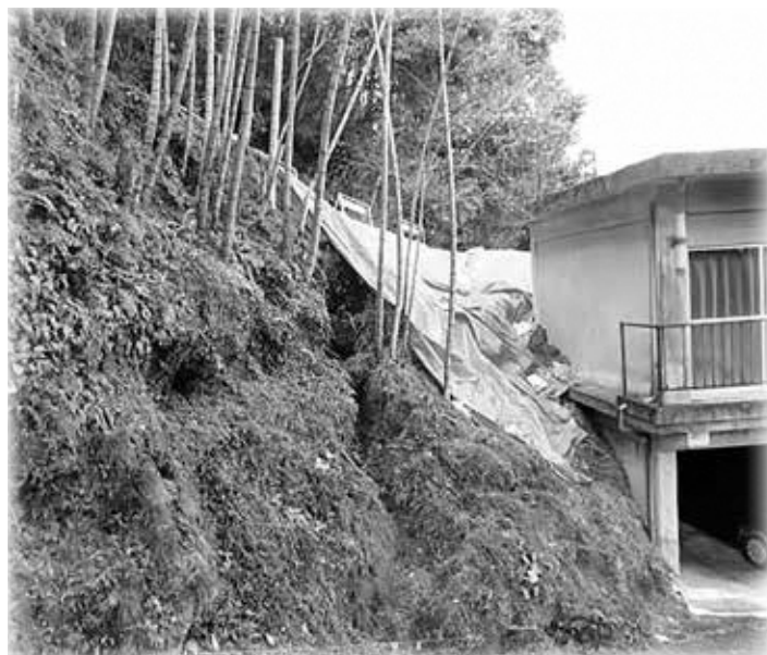
台風14号で路肩が崩れた法ケ平尾川端線(高尾)