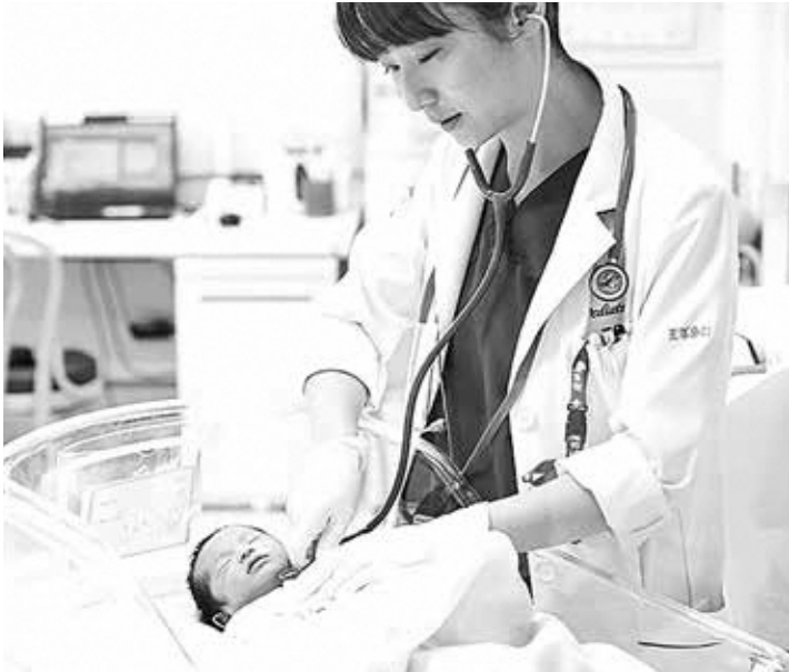
新生児誕生（大学病院）

Q 先の第3回定例会において、「南山城村子育て応援特別定額給付金事業（コロナ分）」が施策となり、令和2年4月28日から令和3年3月31日までの出生児とした。