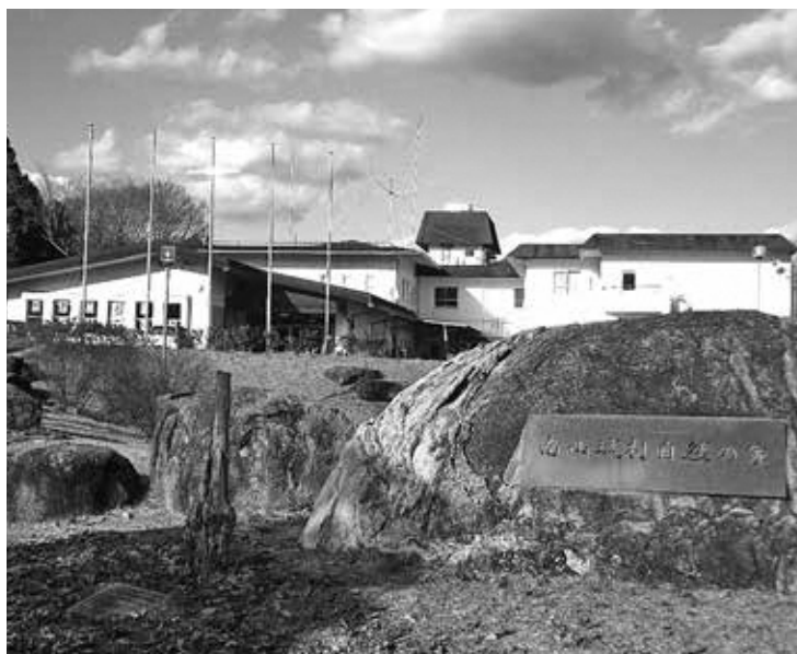
指定管理を検討中の自然の家（田山）