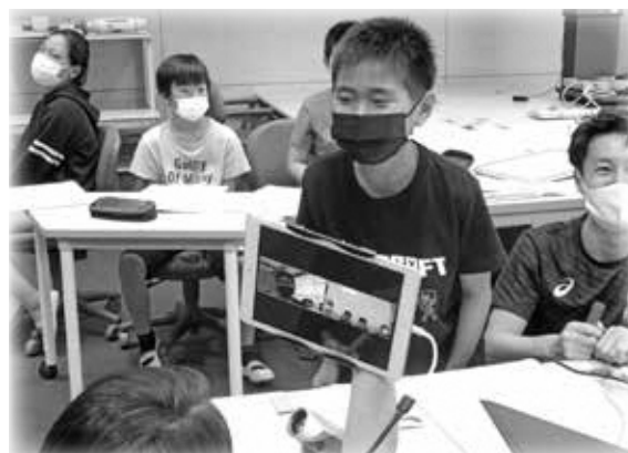
タブレット活用の授業（南山城小学校）