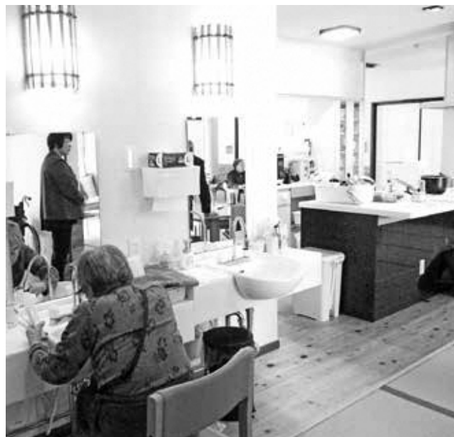
高齢者介護施設（奈良）

Q 自宅に住み続けたい高齢者本人の意思を尊重し、老々介護で家族介護の基盤が弱まっている中、何らかの居宅介護を支える施設が必要だとこれまで確認してきた。 3月に出された村の総合戦略には、今年度調査・計画、3年度事業者