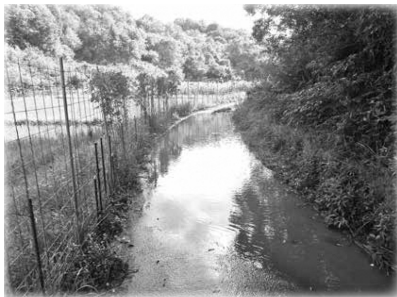
台風14号で埋まった土側溝 橋ヶ谷東出線(田山)