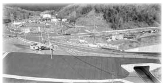
国道整備による水道切替工事(今山)