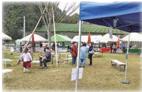
ウチ茶博を開催（道の駅）

ただイイ物を作るだけの生産者ではなく、新たな特産品の開発を村の他品目の生産者と連携し、