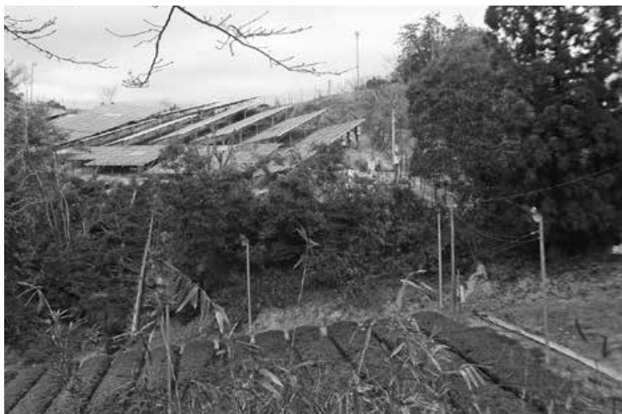
太陽光発電所の建設現場(田山)