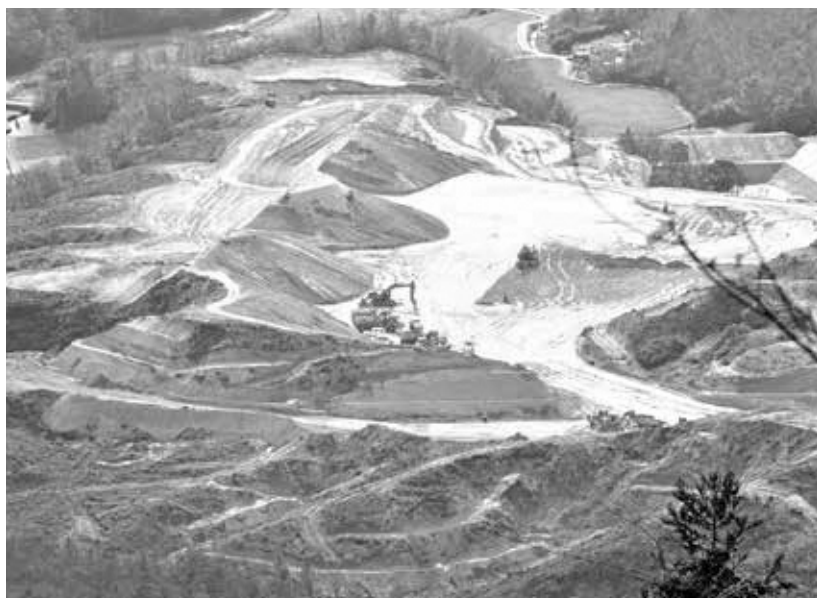
これはなんだ！昔の面影なし（メガソーラー開発地）

「特区法指定区域では、開発民間事業者は国や自治体のデータを要求でき、個人情報民間業者に流れる可能性がある。