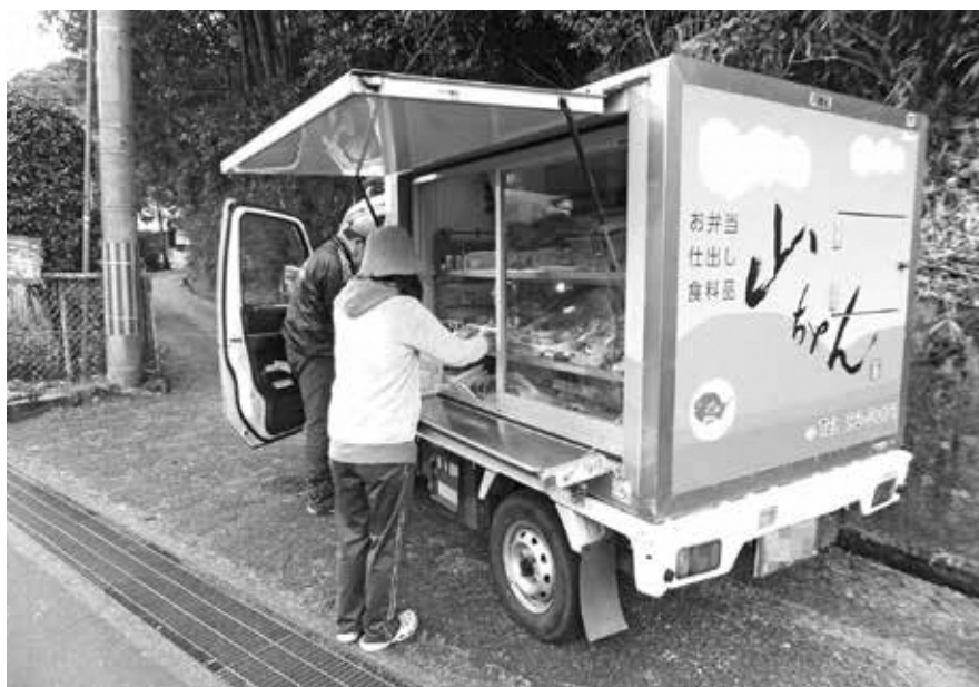
現在、実施されている移動販売

としてデマンドタクシーを実施するとともに、道の駅でも事前申し込みにより、商品を届けるサービスを行っているが、十分とは言えない。