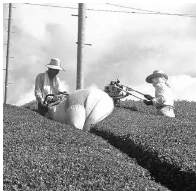
傾斜地での茶刈り作業