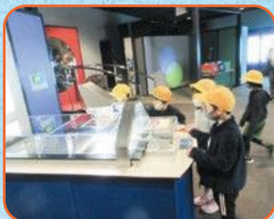
2年生 きつづ科学ふおとん・東大寺大仏殿