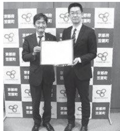
左：中 笠置町長 右：鷲見代表取締役CEO

今回の協定では、笠置町と同社にて直接協定を結ぶものであり、それぞれが持つ資源や特長を生かしながら連携協力し、地域のさまざまな課題解決や地域の持続的発展に寄与する公民連携を促進することを目的とした協定になります。