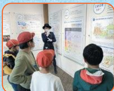
4年生 京都市市民防災センター・文化パルク城陽