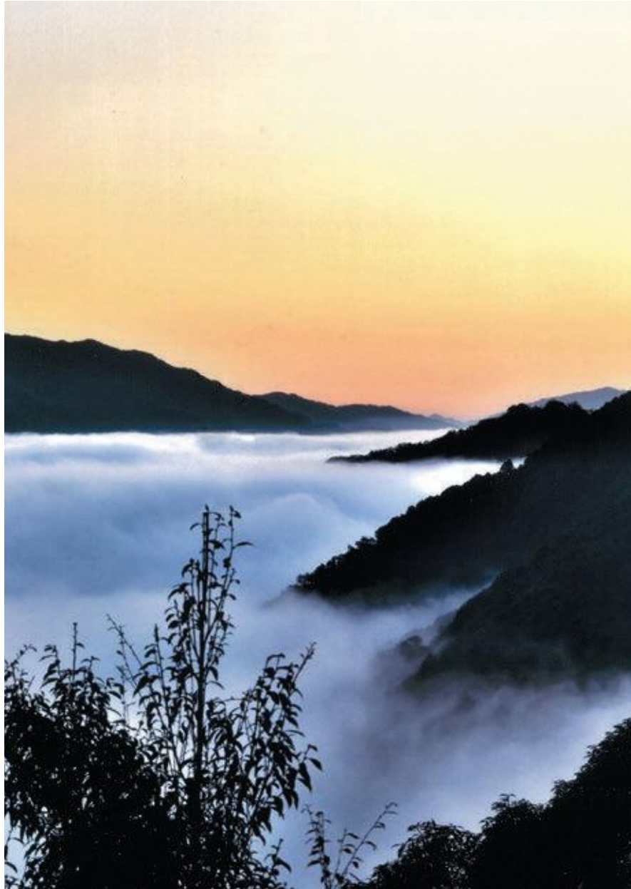
表紙写真：第14回笠置町フォトコンテスト応募作品「-6℃」