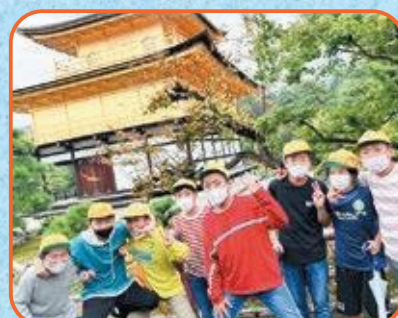
6年生 金閣寺・二条城・佛教大学