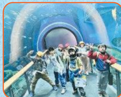
3年生 琵琶湖博物館