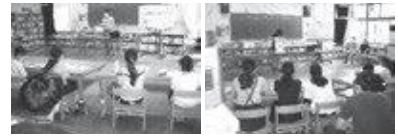
認知症について学ぶ 脳トレーニングの体験

住み慣れた笠置町で、高齢者を温かく見守るキッズサポーターの一員として活躍をしてくれると期待しています。