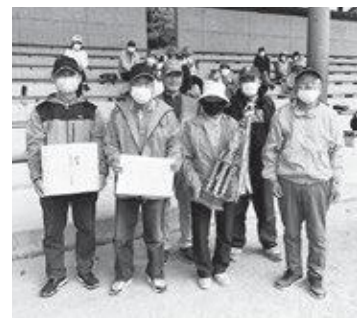
笠置町町長杯GG大会