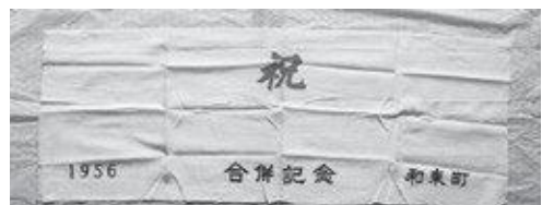
1956年（昭和31年）和束町・湯船村合併記念手ぬぐい

その後、湯船村有林は合併後も湯船財産区有林とすることで話し合いがまとまり、1956年（昭和31年）9月30日湯船村も合併して、現在の和束町が誕生したのです。