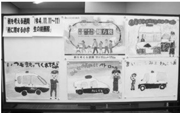
笠置町産業振興会館にて

11月11日(金)～17日(木)までの「税を考える週間」の一環として、笠置町・南山城村の小学校の児童たちが思い思いに描いた絵画作品を展示しました。