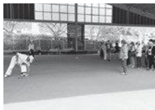
連合教育長杯GB大会