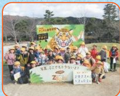
1年生 京都市動物園