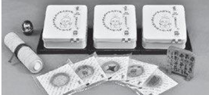
忍者のおやつ缶 (合名会社 平木製菓)