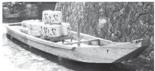
復元された高瀬船（京都市中京区一之船入町）

なぜ、この時期に通船が計画されたのでしょうか。和東郷から出る木柴や薪炭などは陸路木屋まで運び、帆掛け船に積んで木津川を淀や伏見に運んでいました。江戸時代半ばになると、信楽の陶器類の運搬が増加し、陸路だけでは対応できなくなってきたようです。当時、最も大量に安全に荷物を運送する手段は、船でした。和東川を船で荷物が運べたら、というのは和東の人々の大きな願いだったのかもしれませんが。