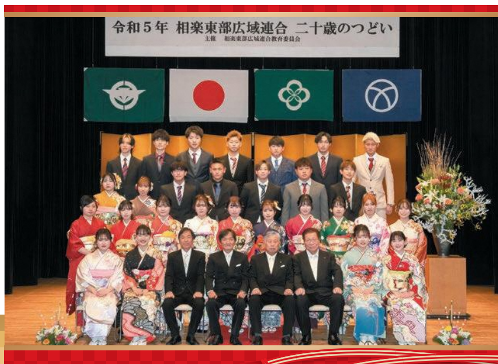
和束中学校区の二十歳のつどい参加者(和束町)