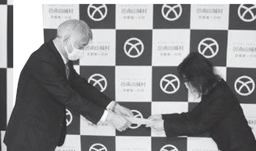
委嘱状伝達の様子