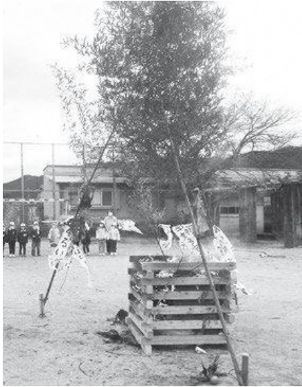
和束町 とんど焼き

笠置町では1月8日（日）、西部ふれあい広場（西部区集会場の広場）でとんどまつり、和束町では1月16日（月）、和束町児童公園でとんど焼きがおこなわれました。子どもたちが書いた書初めや、住民の方からは、しめ縄などお正月飾りが集まり、とんどやぐらが燃え上がるのを見ながら、一年間の無病息災をお祈りしました。