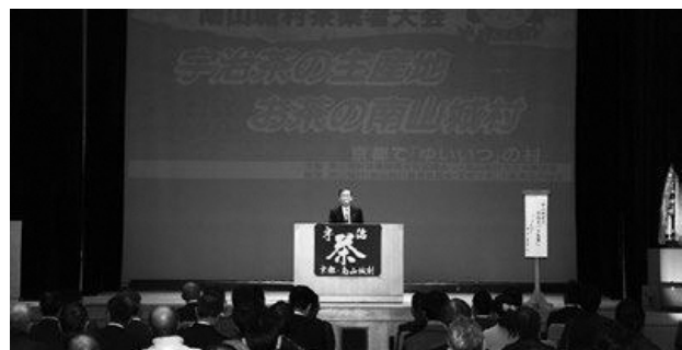
過去開催時の様子