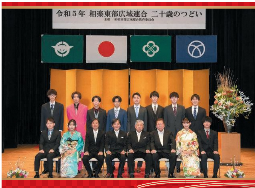
笠置中学校区の二十歳のつどい参加者(笠置町・南山城村)

今後、二十歳となられたみなさんが、それぞれの場所でご活躍されることを心より祈念します。