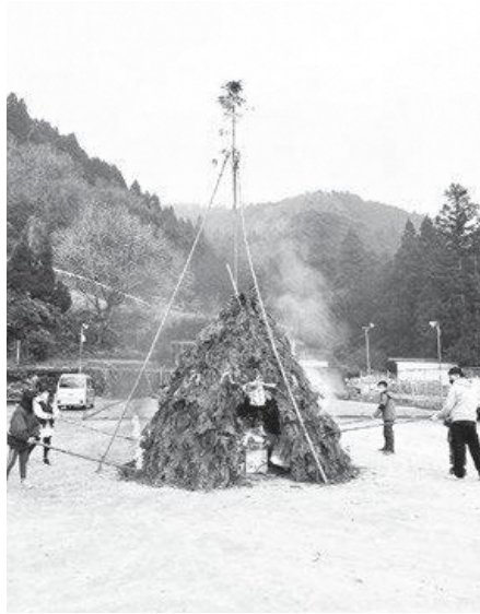
笠置町 とんどまつり