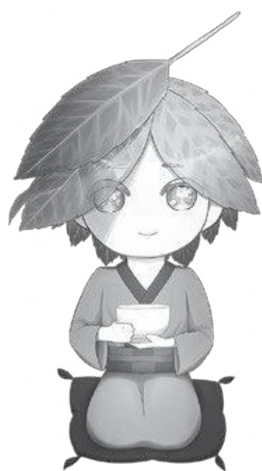
南山城村公認キャラクター第1号