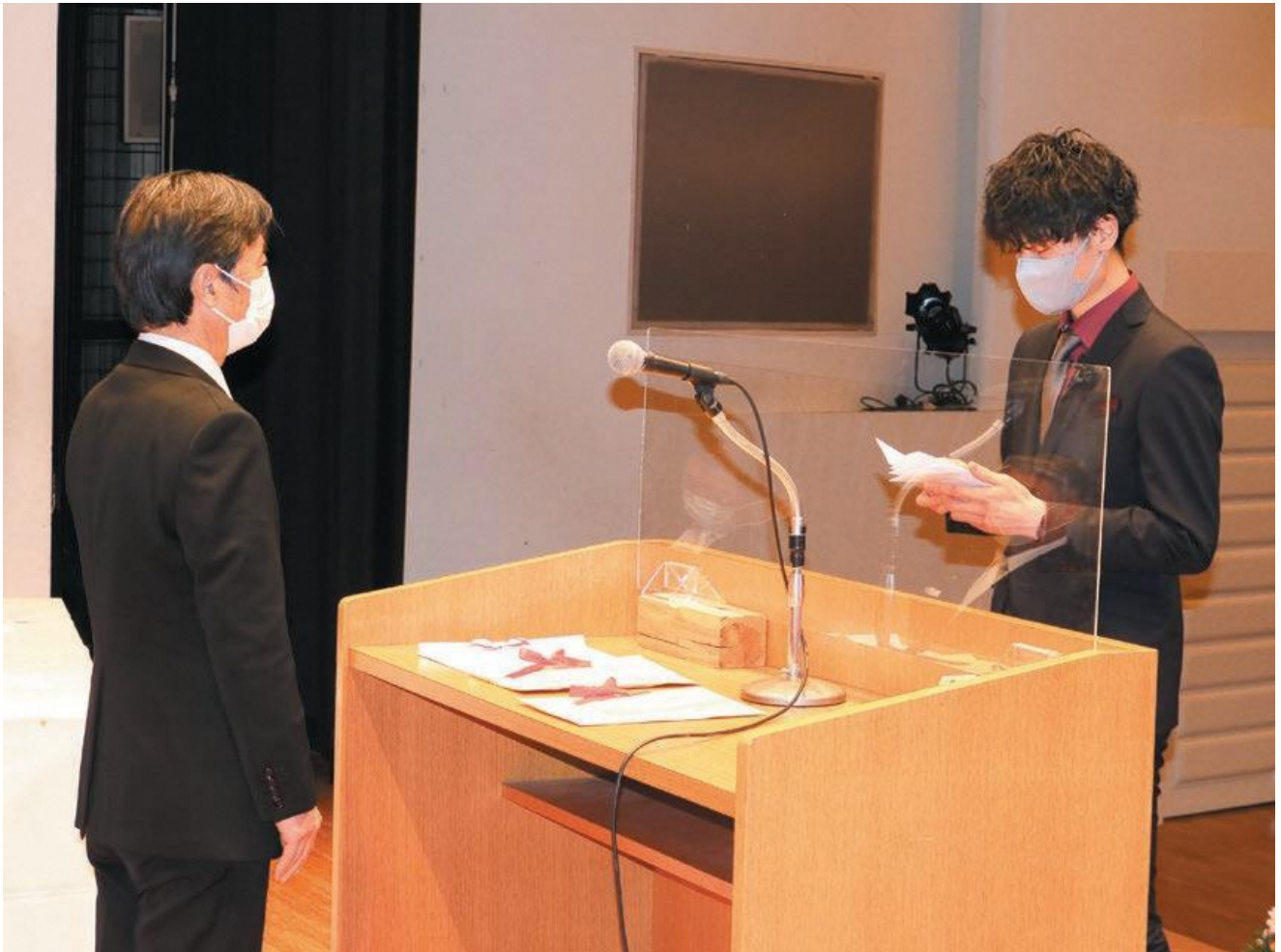
表紙写真：令和5年相楽東部広域連合 二十歳のつどい「誓いのことば」