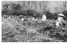
第4回の活動写真から

2月～3月に、淀川流域の上流から下流まで7エリアに分かれエリアごとに一斉清掃を実施する淀川水系一斉美化アクションがおこなわれます。この一環として木津川エリアでおこなう活動が木津川流域クリーン大作戦です。