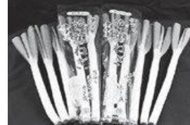
伊賀の芭蕉ねぎ (伊賀ふるさと農業協同組合)