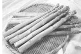
アスパラガス (伊賀ふるさと農業協同組合)