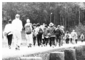
恋路橋を歩く参加者のみなさん

関西本線木津亀山間活性化同盟会では、関西本線の利用促進と沿線の活性化をおこなうとともに、それぞれの地域の観光や魅力を発信し、今後も関西本線を利用していただける活動に努めてまいります。