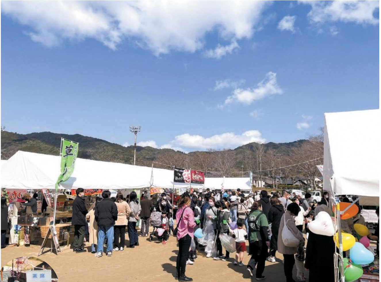
表紙写真：3月19日（日） 茶源郷まつりの様子