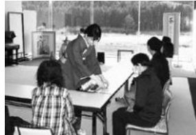
交流茶会参加の様子