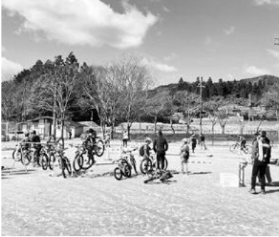
マウンテンバイク体験コーナー

前日は雨が降り心配されましたが、当日は天候にも恵まれ、和束運動公園内は終始笑顔に満ちあふれていました。