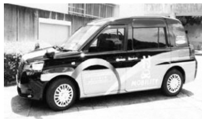
やまなみ交通「村タク」

各公共交通の利用方法や不明点、ご質問などはやまなみ交通運営協議会が拠点を設置しています。南山城村モビリティセンター（JR大河原駅）☎080・9593・4943まで気軽にお問合せください。