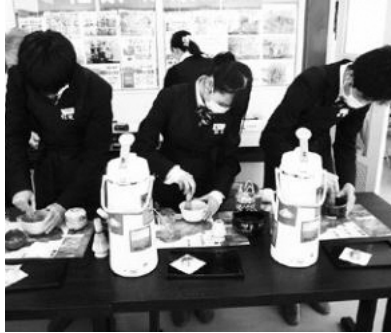
日本茶インストラクターによる茶席