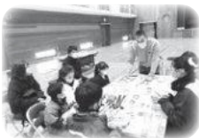
(相模東部広域連合教育委員会)