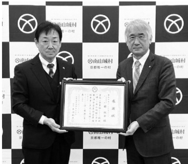
(左から郡代表取締役社長、平沼村長)