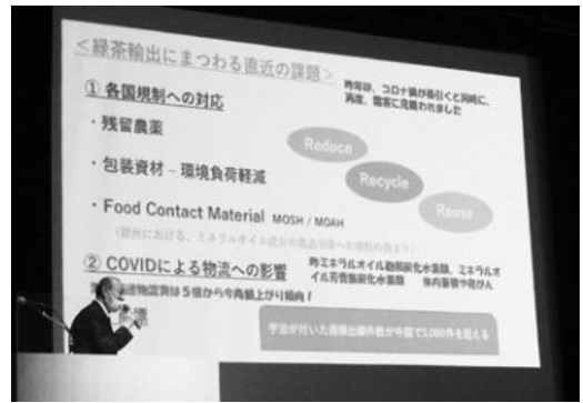
茶業者大会「講演」の様子

なお、寄贈いただいた図書は村内の小中学校、図書室など公共施設にて配架しておりますのでぜひご一読ください。