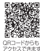
QRコードからもアクセスできます。