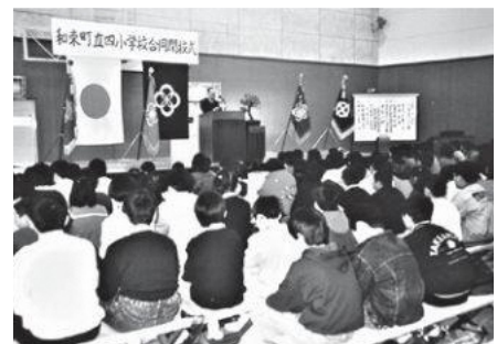
和束町立四小学校合同閉校式(1992年3月24日)

その後、高等小学校の併設や国民学校への改称を経て、戦後に小学校となりますが、4校の体制はわかりませんでした。しかし、1992年(平成4年)4月に4校は和束小学校に統合されました。それからでも30年が経過し、旧4小学校の在りし日をしのぶ校舎等は残されていません。町史編さん室では、西和束、中和束、東和束、湯船の各小学校の歴史をたどる写真集を作成いたしました。