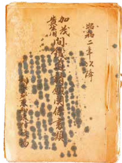
「加茂・貴生川間鉄道請願関係書類」 旧和束村役場の資料が和束町役場に保管されていきました。

HP https://www.union.sourakutoubu.lg.jp (和束町史編さん室)