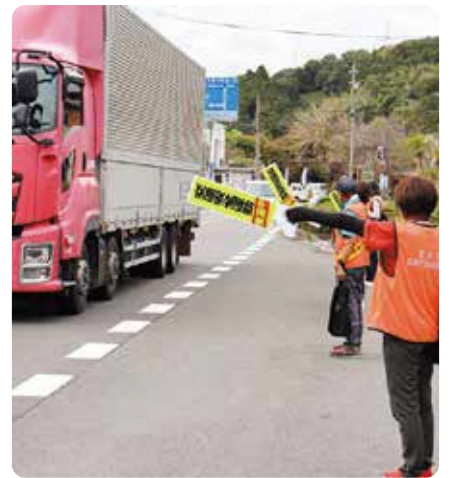
笠置町：国道163号での注意喚起