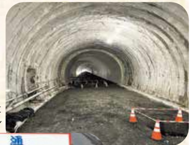
貫通した 鷲峰山トンネル