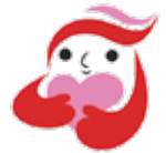
犯罪被害者等支援 シンボルマーク 「ギョっとちゃん」