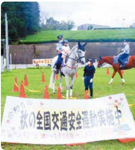
南山城村：平安騎馬隊による体験騎乗

道の駅の利用者に対して啓発物品の配布のほか、京都府警察平安騎馬隊とともに、交通安全マナーの向上を呼びかけました。