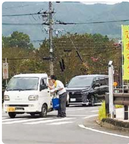
和束町：白栖橋交差点での啓発活動