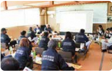
防災知識醸成訓練