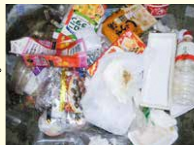
プラスチック容器包装ごみに混ざっていた紙類・ペットボトル類