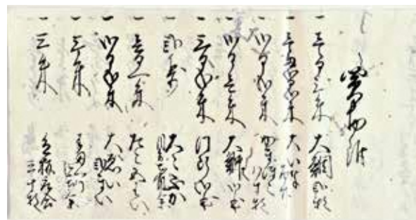
釜塚村が購入した魚介類(町史編さん室保管文書)

HP https://www.union.sourakutoubu.lg.jp (和束町史編さん室)