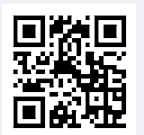
京都マラソン公式HP

問 京都市市民スポーツ振興室 ☎075・222・3138 FAX075・213・3367