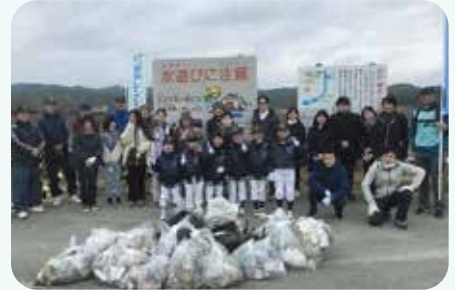
第5回の活動の様子