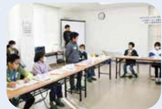
感想を発表する様子