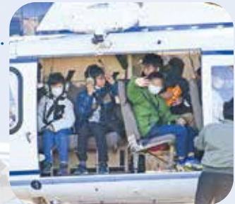
ワクワク、ドキドキした様子で離陸を待つ子どもたち

この日は定住自立圏内の小学生4・5・6年生19人が参加し、府県をまたいだ交流を深め、圏域住民としての一体感をより一層強めた1日となりました。