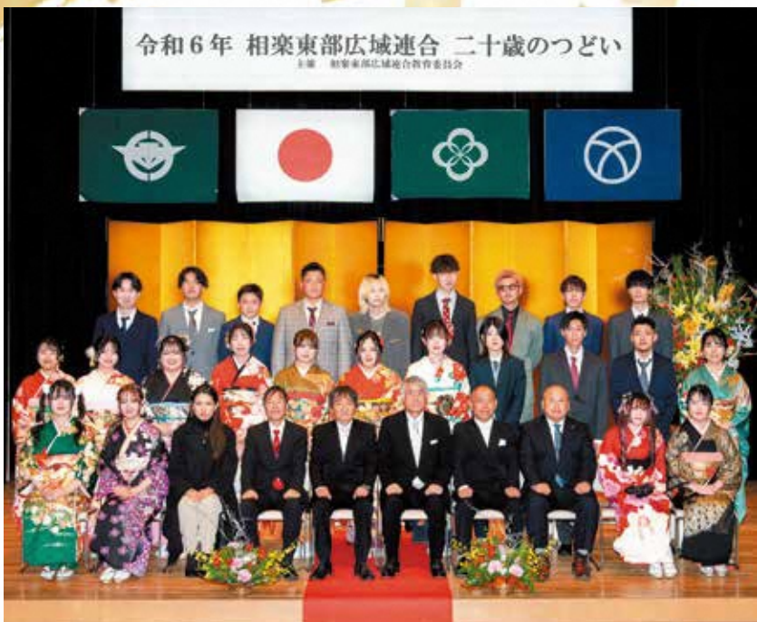
和束中学校区の参加者 (和束町)

1月8日(月) 祝、成人の日に相楽東部広域連合教育委員会主催による「令和6年二十歳のつどい」がおこなわれ、笠置町・和束町・南山城村で合わせて37人の二十歳となる参加者が集いました。会場となった南山城文化会館(やまなみホール)では、スーツや振袖などの華やかな晴れ着をまとった参加者が門出を祝い、来賓や恩師に見守られながら式典が執り行われました。