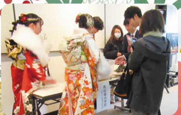
タイムカプセル開封の様子