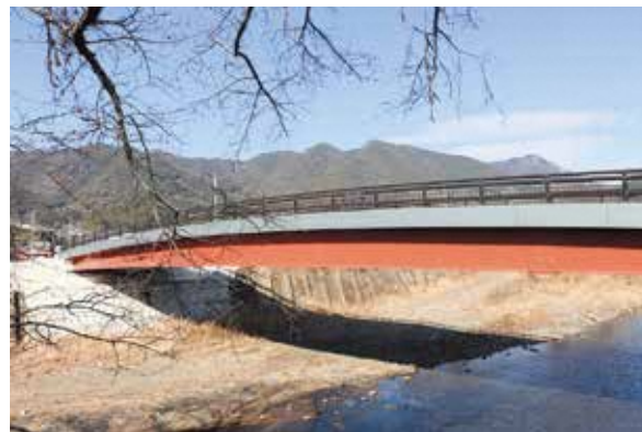
新しくなった祝橋

HP https://www.union.sourakutoubu.lg.jp (和束町史編さん室)