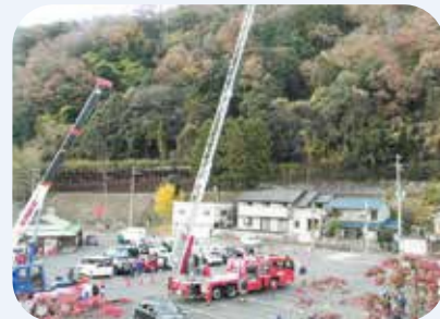
はしご車や災害救助車両の展示

地震はいつ発生するかわかりません。災害には日ごろの備えが大事となりますので、各ご家庭では避難場所への経路の確認や、3日程度の食糧等の備えをおこない、自助で取り組めるものは取り組んでいただきますようお願いいたします。