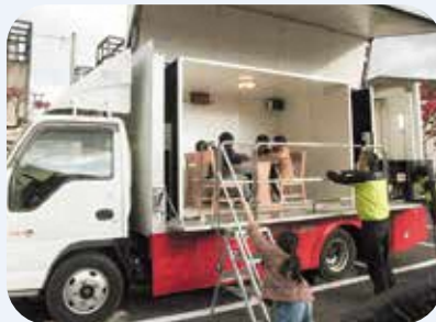
起震車体験の様子

さて、新年を迎えた1月1日の午後に能登半島を震源とする大規模な地震が発生しました。被災されました皆さまには心よりお見舞い申し上げます。1日も早い復旧、復興がなされますようお祈り申し上げます。