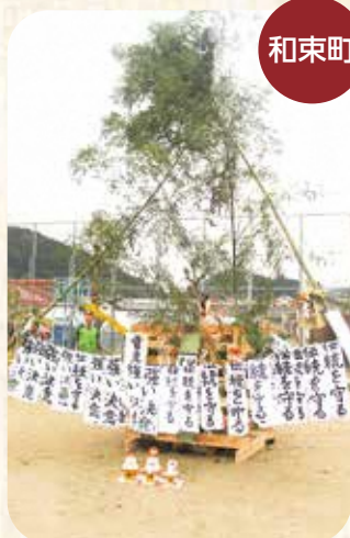
和束町児童公園での様子