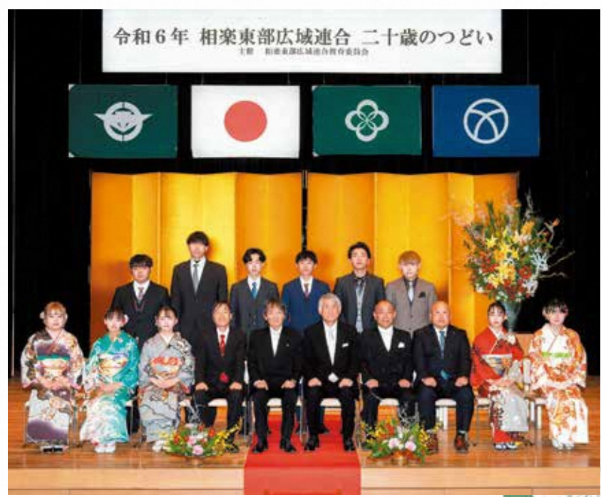
笠置中学校区の参加者 (笠置町・南山城村)

今後、二十歳となられたみなさんが、それぞれの場所で活躍されることを心より祈念します。