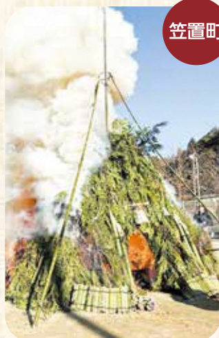
西部ふれあい広場での様子