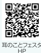
耳のことフェスタ HP