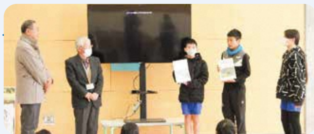
村の小中学生に (合)南山城観光作成の冊子「村を歩こう」が贈られました。