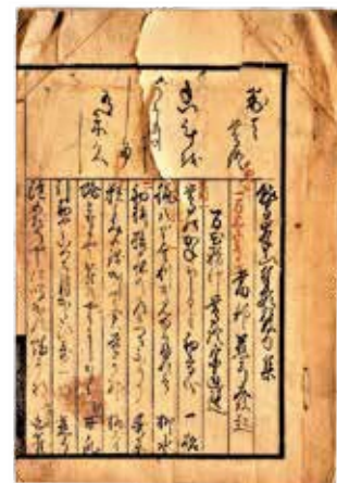
鷺峰山奉額発句集

HP https://www.union.sourakutoubu.lg.jp (和東町史編さん室)