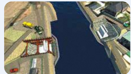
3次元データによる立体的な工事図面