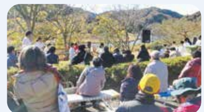
南山城村農林産物直売所で開かれた 「いきいきマルシェ」