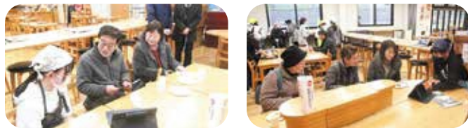
一人一人丁寧に説明をおこなう6年生たち

3月12日(火)南山城小学校6年生13名が、総合学習の一環として、道の駅お茶の京都みなみやましろ村で来場者に、パワーポイントや手作りのパンフレットを使い説明をおこないました。また村で作られた茶葉を使って淹れたお茶と市販のお茶の飲み比べとともに、パウンドケーキをふるまい、村の魅力を知らせてもらいました。