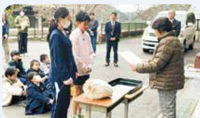
笠置小学校・笠置保育所