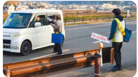
和束町：府道5号での啓発活動②