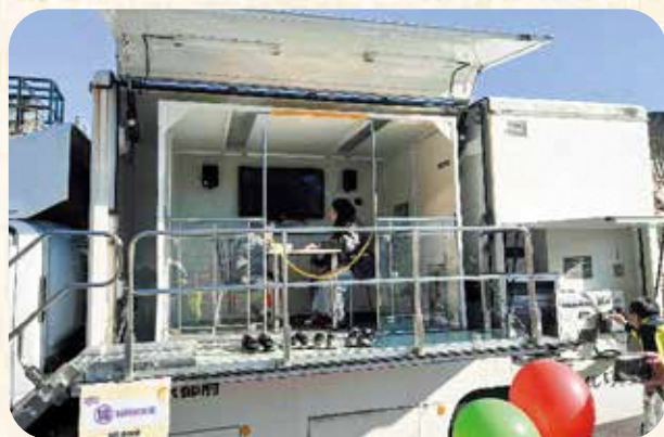
起震車体験の様子

交通安全と防災の両面から学びと発見いっぱいの日となりました。今後も南山城村では、このような地域の皆さんが安心して過ごせる取り組みを推進してまいります。たくさんのご参加、ありがとうございました！