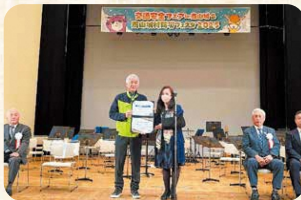
ガーディアン72BOXの目録贈呈