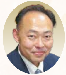
相楽東部広域連合長 笠置町長 山本 篤志