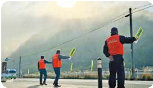
笠置町：国道163号での注意喚起

道行くドライバーや通勤通学の皆さんに啓発物品を配り、交通事故防止の呼びかけをしました。