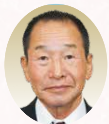
相楽東部広域連合 教育委員会教育長職務代理者

南山城村の未来は村民の皆様のご協力のもとに築かれます。今年も「住民が主役」で、一つ一つの課題を解決し、安心と希望に満ちた村を目指して邁進してまいります。本年もどうぞよろしくお願い申し上げます。