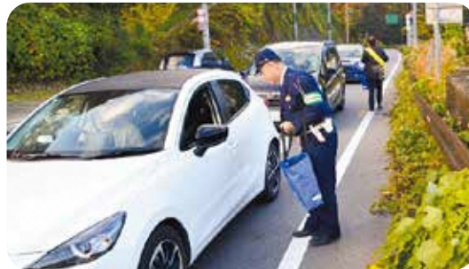
和束町：府道5号での啓発活動①