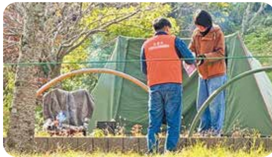
笠置町：笠置キャンプ場での啓発活動