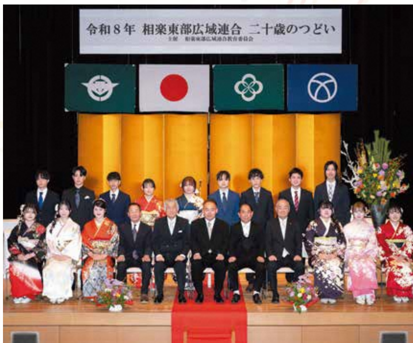
笠置中学校区の参加者 (笠置町・南山城村)

今後、二十歳となられた皆さんが、それぞれの場所で活躍されることを心より祈念します。