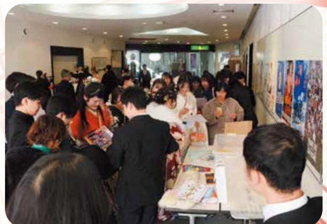
タイムカプセル開封の様子