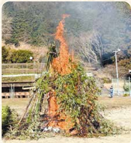
笠置町：笠置児童館とんどまつりの様子