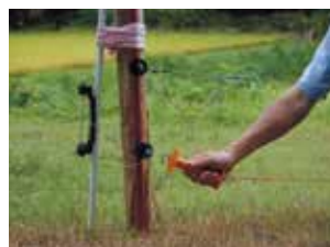
侵入防止柵の設置