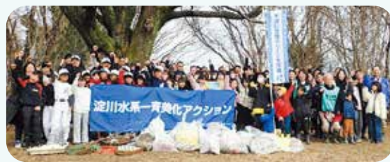
第7回の活動写真から