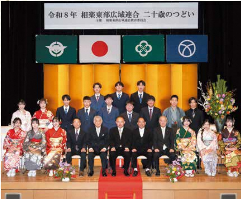
和束中学校区の参加者 (和束町)

会場となった南山城村文化会館(やまなみホール)では、スーツや振袖などの華やかな晴れ着をまとった参加者が門出を祝い、来賓や恩師に見守られながら式典が執り行われました。