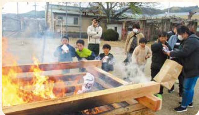
和束町：和束町児童公園での様子