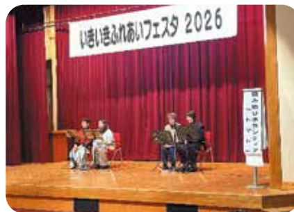
読み語りボランティア「トマト」