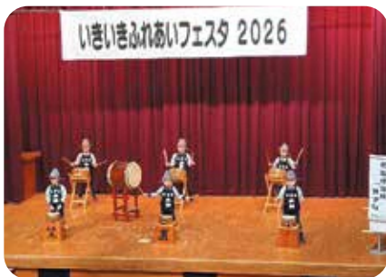
笠置保育所「きずな」