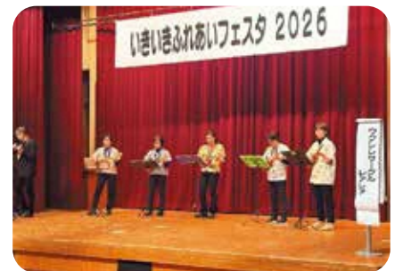
ウクレレサークル レアレア