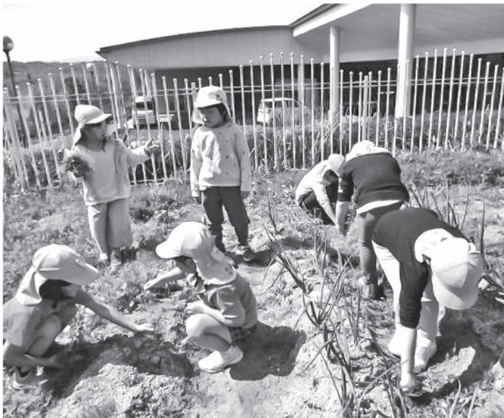
たまねぎ大きくそーだて (保育所)

Q 進入路の計画が進んでいますが、高齢者福祉事業所誘致計画はどこまで進んでいますか。