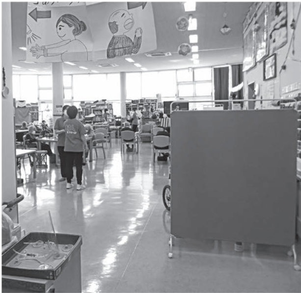
村社協によるディサービス（保健福祉センター）