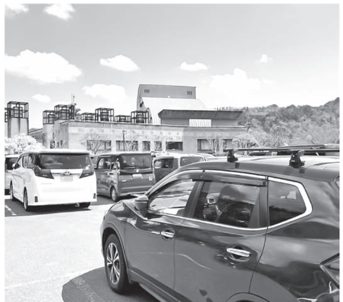
常時個人駐車場としての利用。(やまなみホール)