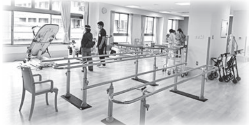
4月から開始の回復期リハビリ病棟(山城病院)