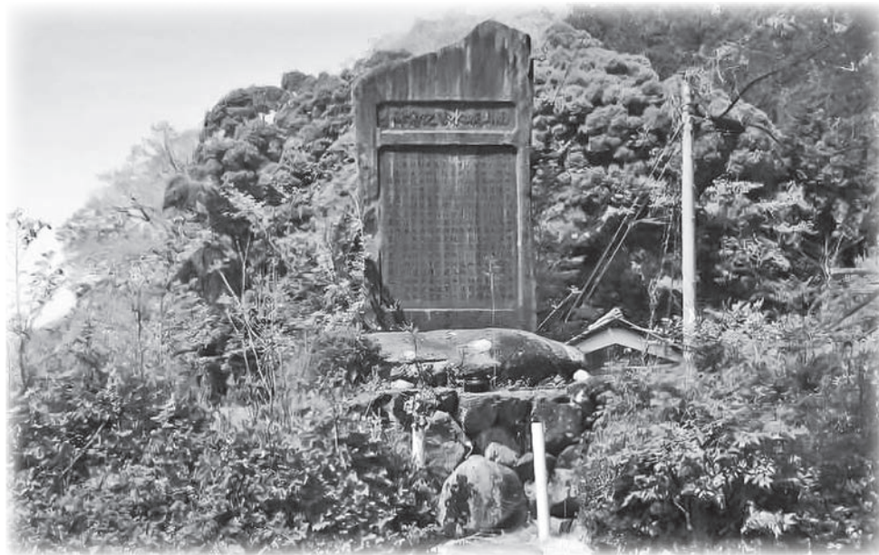
70周年を迎える昭和28年の南山城水害記念碑（本郷）

Q 昭和28年の南山城水害から、70年に当たる。式典とか追悼式をすべきでないか。 A 今は考えていない。これから、検討したい。