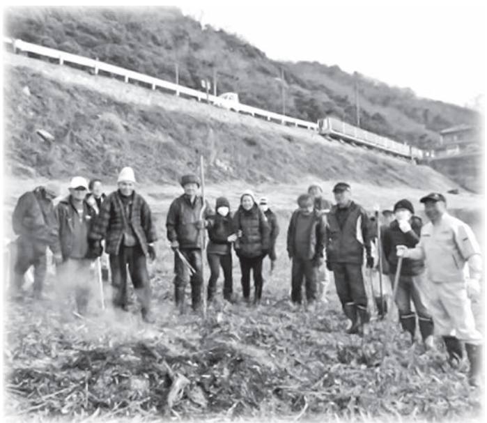
清掃作業参加者（大河原駅前河川敷）