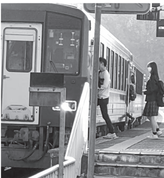
通学補助を期待（月ヶ瀬口駅）

Q ネットで調べると「月ヶ瀬口駅から木津駅まで年間14万2800円。」今年4月からの高校生は42名。100%補助で600万円。50%補助で300万円。村の予算27億円から見れば、対応できる額だ。 A 村長 検討する。