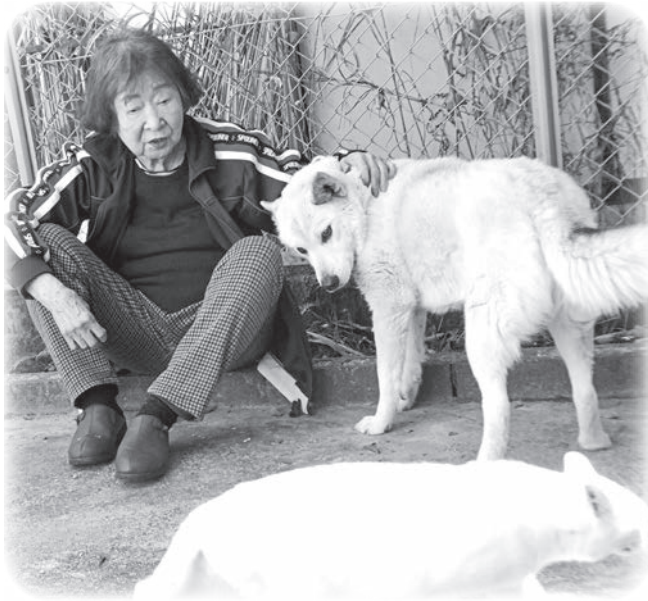
犬や猫との暮らし