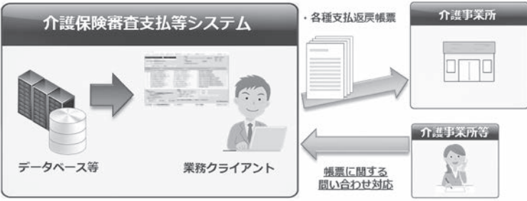
介護保険審査支払等システム