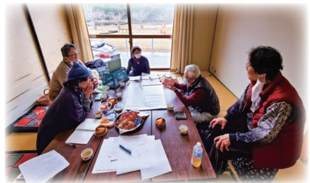
夫妻から昔の話を聞く

鉄道にまつわるお話を聞 きました。むかしの道具 や写真を見せてもらいな がら、話が盛り上がり 時間があつとつ間に過 ぎました。