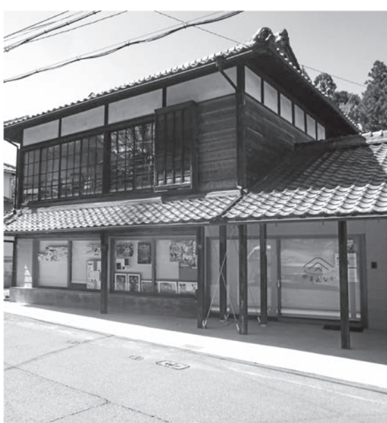
移住交流拠点「やまななか」（田山）

Q 必要な人は入院できるよう。住民には、内容の周知をされたい。 人口減少の対応策は Q 令和3年度の村の新児誕生数3人、4年度4人と聞く中、質問する。①移住促進を何度も提唱するが、積極的施策が出てこない。現状をもって十分としているのか。 ②「南山城村結婚新生活補助金」がある。