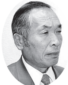
徳谷 契次 議員

Q 政府は2月に新型コロナウイルス対策で、感染上の位置付けを季節性インフルエンザと同等の「5類」に下げの方針を出した。村は高齢者率も高く、村内の医療機関、近隣の医療機関も限られている中で、次の質問をする。