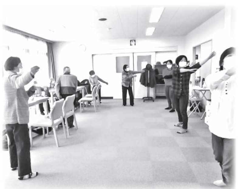
元気で身体を動かして(ふれすこデイ)