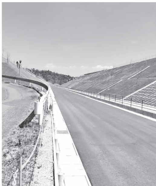
村譲渡に問題がある東西道路

メガソーラーが完成間近だ。村民説明会で、業者は「太陽光パネルは見えないように景観に配慮する」と約束したが、この場所からも黒いパネルが見える。業者は本当に信用できるのか。子どもたちの将来のために、大人たちは約束を守らせ、自然を守り、この村を守る義務がある。