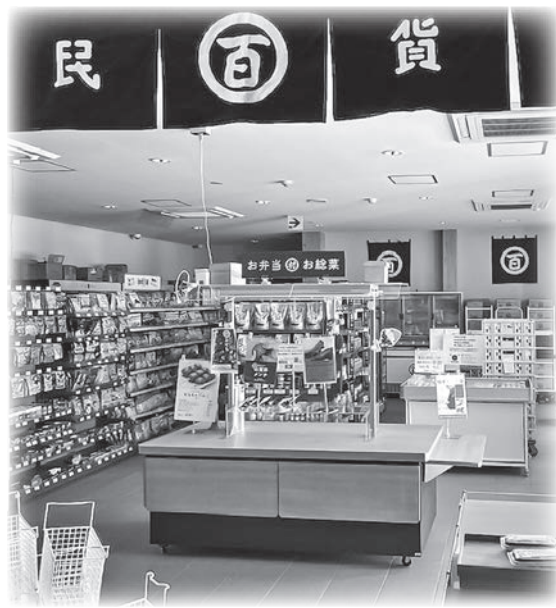
市民の生活用品にも対応している（道の駅）