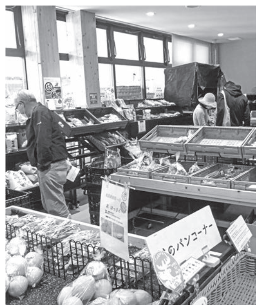
野菜売り場（道の駅）