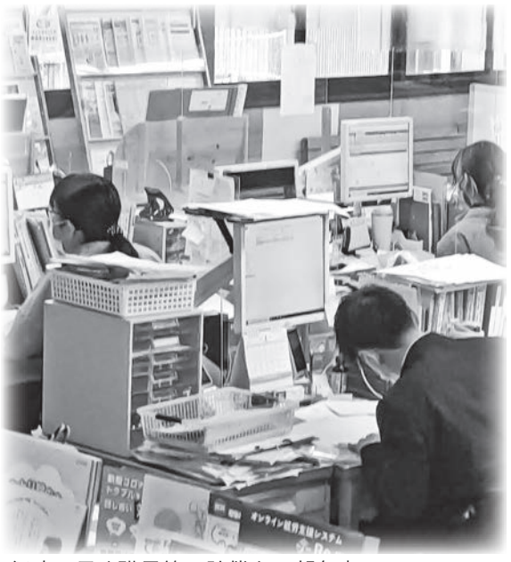
行政の長や職員等の賠償を一部免責