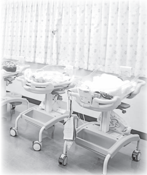
すくすくと育て新生児（山城病院）

「相楽郡広域事務組合」から「相楽広域行政組合」に名称変更に伴い、規定している条例も改正する。