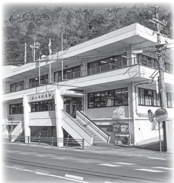
基金積み立てが始まった(役場)