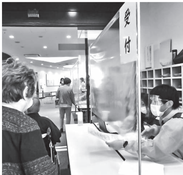
コロナワクチン接種（やまなみホール）

Q 政府は2月に新型コロナウイルス対策で、感染上の位置付けを季節性インフルエンザと同等の「5類」に下げの方針を出した。村は高齢者率も高く、村内の医療機関、近隣の医療機関も限られている中で、次の質問をする。