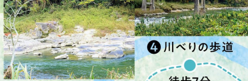
4 川べりの歩道 徒歩7分

日本遺産「日本茶800年の歴史散歩」を構成する宇治茶の生産景観。珍しい縦畝の茶畑が斜面に広がる特徴的な景観です。