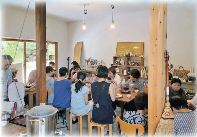
会話がはずむランチ会