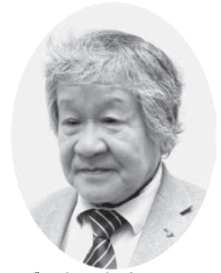
ずきひさお 議員 頭 鬼 久 雄

できる。」ということ。高齢者の方もスマートフォンを持つ方も増え、議会中継の手段としてはインターネット配信と考える。