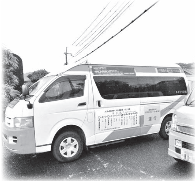
住民の足 相楽東部広域バス (月ヶ瀬口駅前)