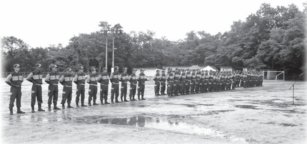
第26回南山城村消防の操法大会（総合グラウンド）