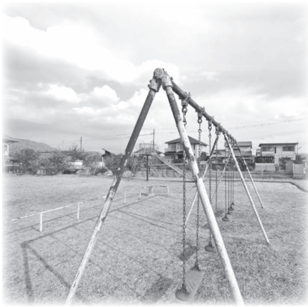
整備が待たれる遊具 (NT北公園)