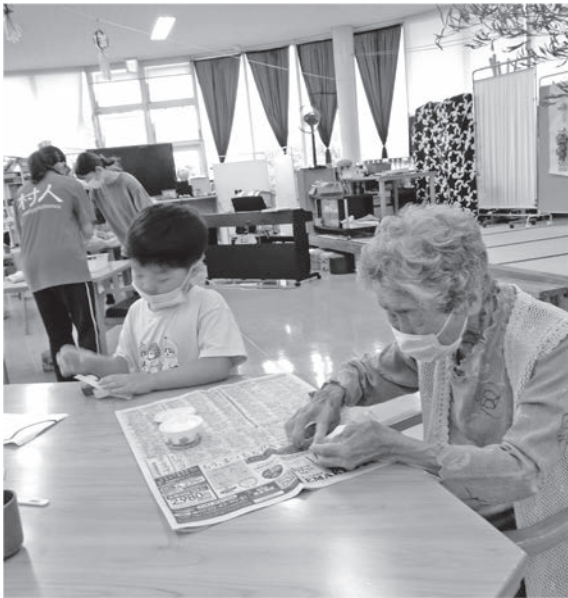
七夕飾りで保育園との交流（社協）

Q 事業者誘致の目的は。 A 村長 70床の特養と10床のショートステイ。リハビリ特化型の通所介護、訪問介護、訪問看護で在宅サービスをする。