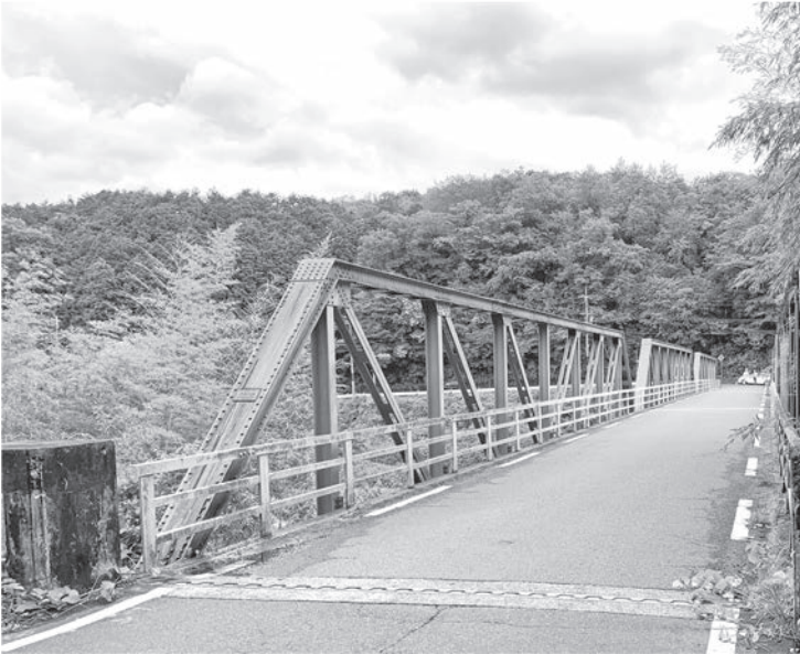
架け替えが待たれる笹瀬橋

Q 府道月ヶ瀬今山線は村にとって重要な幹線道路の一つであり、生活を営む上で欠かすことのできない大切な道路である。懸念されるのが、笹瀬橋の老朽化が進み交通規制