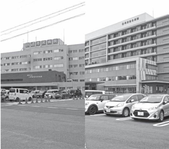
伊賀市内にある病院

Q 6年度は2200万 円余りの観光予算だが、 受け皿の村民還元ではな い。村民に還元される観 光施策を実施されたい。