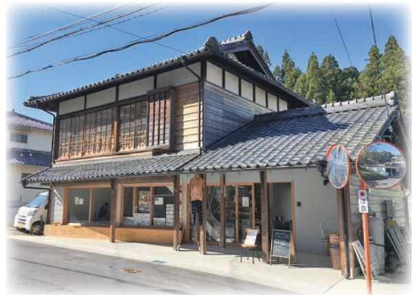
村のファンを増やす「やまんなか」(田山)

移住相談があると、まずはイベントにお誘いします。移住する前に、村民と関わりを持ってもらう事が重要なポイントです。空き物件を見て即座に移住が決まるというのは稀で、それよりもまずは村と関わりを持ち、村民と交流していく中で、自身の気持ちを整理しながら物件を探すというのが、最も無理のない移住のカタチなのではないで