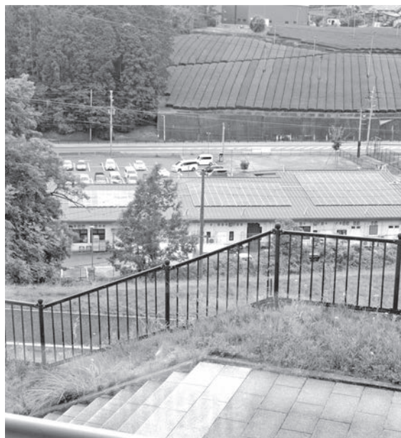
公共施設への光反射が気になる「道の駅」の太陽光

Q 「道の駅」の太陽光発電で太陽の光反射が保育園に影響しないか。 A 村長 設置パネルは、反射防止コーティングのため影響は無い。