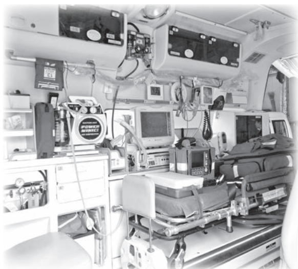
高規格救急車の内部装置 (相楽東部消防署)