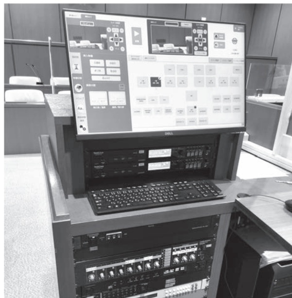
議会中継設備（笠置町役場議場）

Q 議会議員となって初めての一般質問で「議会中継の実施」を提案し続けてきた。 議会での様々な議論は「議会だより」を通じて広報されているが、紙面の制約から臨場感に乏しく審議の詳細がわからないうえ、村長の政策実