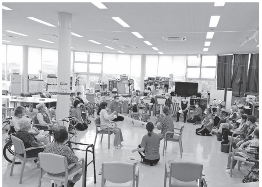
レクリエーションを楽しむ利用者（社協）

また、府の山城南圏域で、福祉政策の最前線を見ている山城南保健所・企画調整課長は、前述第2回の策定委員会にて、次の様に発言している。「府の立場からすると、施設ありきの議論になっているように感じる。本