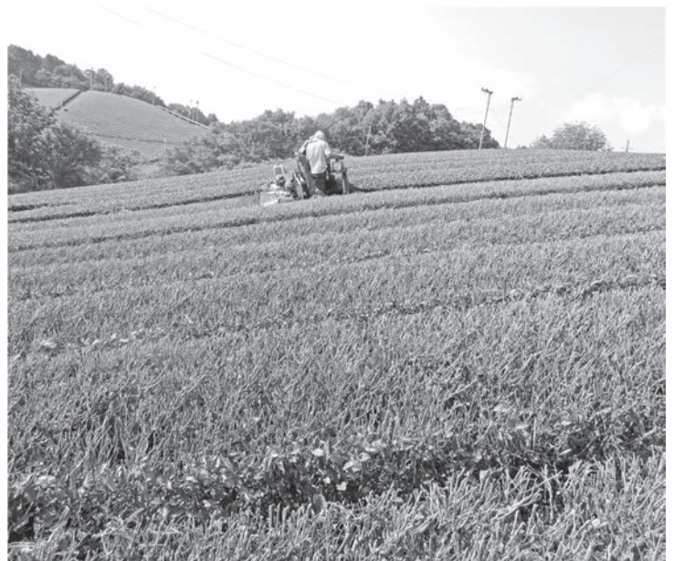
来年に向けて、中刈り更新作業（高尾）

A 村長 肥料高騰による農業経営への負担軽減策をこれまで検討してきたが財源の確保が厳しく、本村独自の支援策の確立には至っていない。