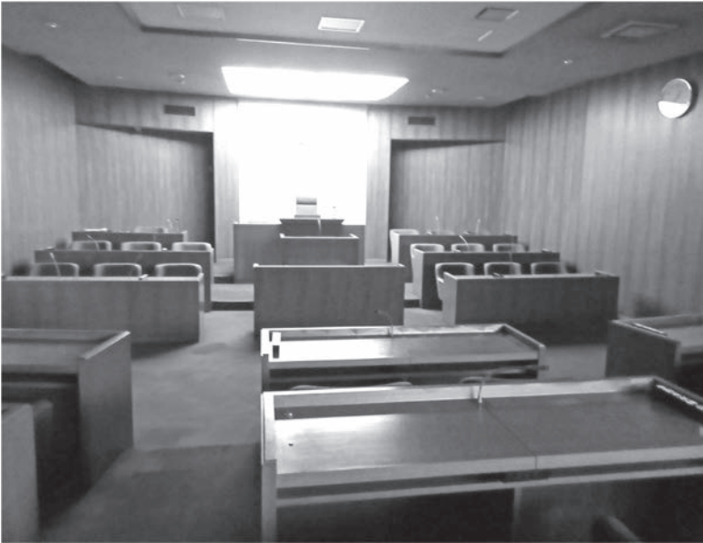
南山城村議会議場

Q 議会のテレビ中継は議会での議論を、肌で感じてもらうのには、一番良い手段と考える。