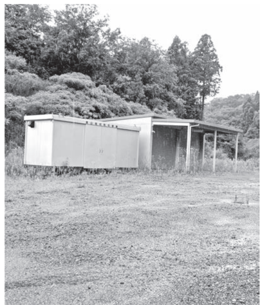
災害に備える防災倉庫（163号沿い）

A 村長 「保育園型認定こども園」に教育的要素を入れ、読み書き計算、自分の考えを言葉にできる力をつけたい。