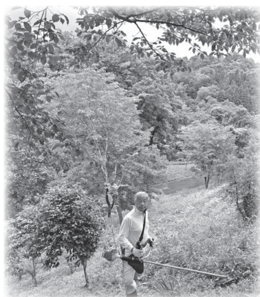
少しでもニュータウンがきれいになれば