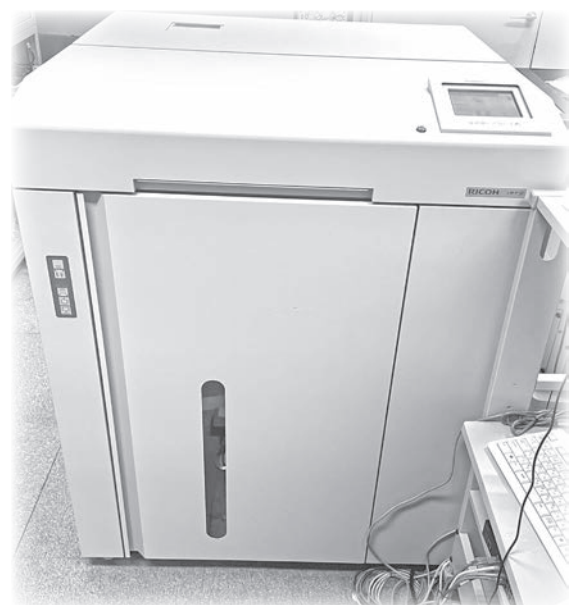
交換が予定されている現プリンター