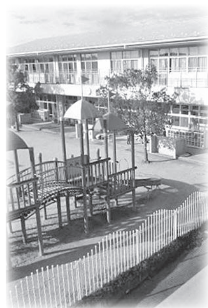
保育園のセキュリティ対策は

①保護者の地位を利用し、保育園の管理者の許可を得ず、無断且つ不当に政治活動を行っていた。 ②署名は保育園で求めているので、強制性が認められ保護者が自由な意思のもとにした署名であるとは考えられない。 ③今回の署名は有志とな