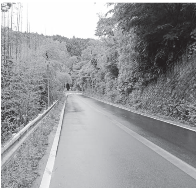
両脇を整備し、道路の安全確保（本郷）

は京都府管理の府道上野南山城線である。道路法及び道路構造令では、道路上の安全な交通を確保するため、原則として、土地所有者が適正に土地の管理をしなければならぬとされており、無闇に道路管理者が竹林を伐採することは出来ない。しかしながら、事故防止の観点から対策が必要であることは十分認識しており、京都府と協議し安全対策を講じていただくよう要望する。