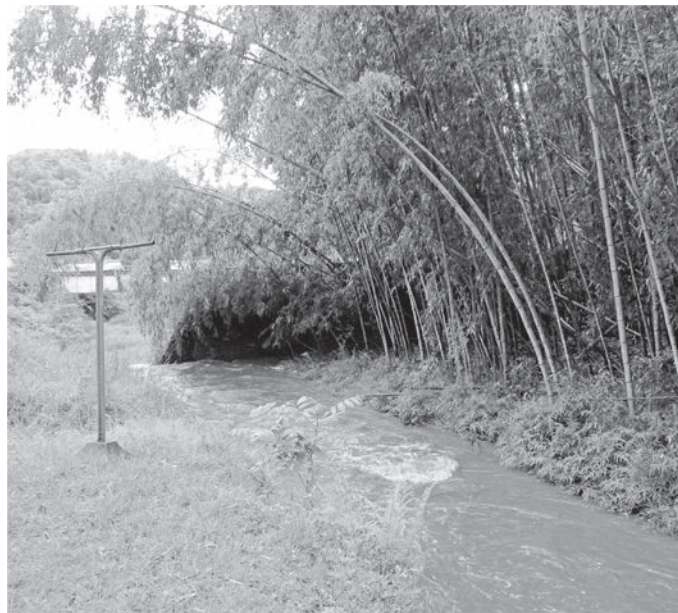
整備が必要な河川（村内）

Q 最近、局地的な集中豪雨などによる山地災害が多発している。被害を未然に防止するためにも日頃から整備が必要であると考えます。山城谷川と渋久川の河川整備の現状と整備計画