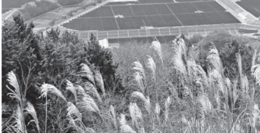
約束と違うメガソーラー監視

Q 四国の地震で「吊り天井」が落下した。やまなみホールも同様な「吊り天井」だが点検したか。 A 村長 点検は適用除外で実施していない。ただ、やまなみホールだけでなく、多くの公共施設も改修時期を迎えており、計画的に実施する。