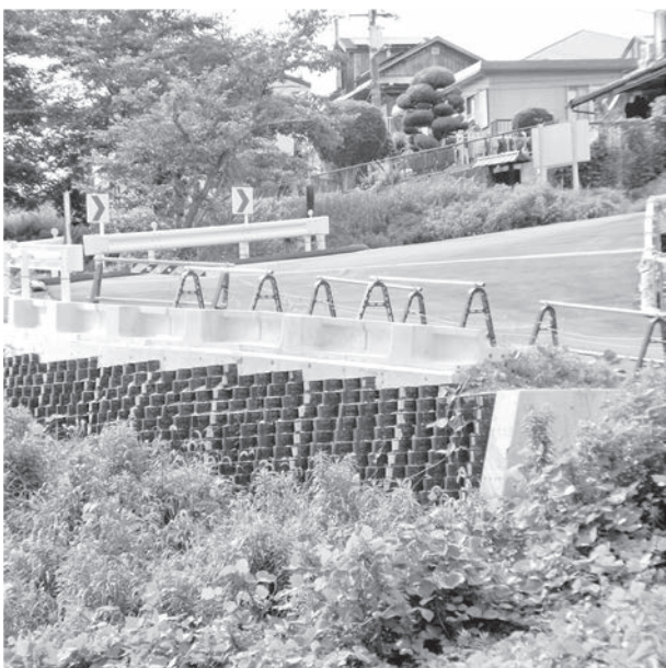
一部完成した特養用地進入路（NT入口）