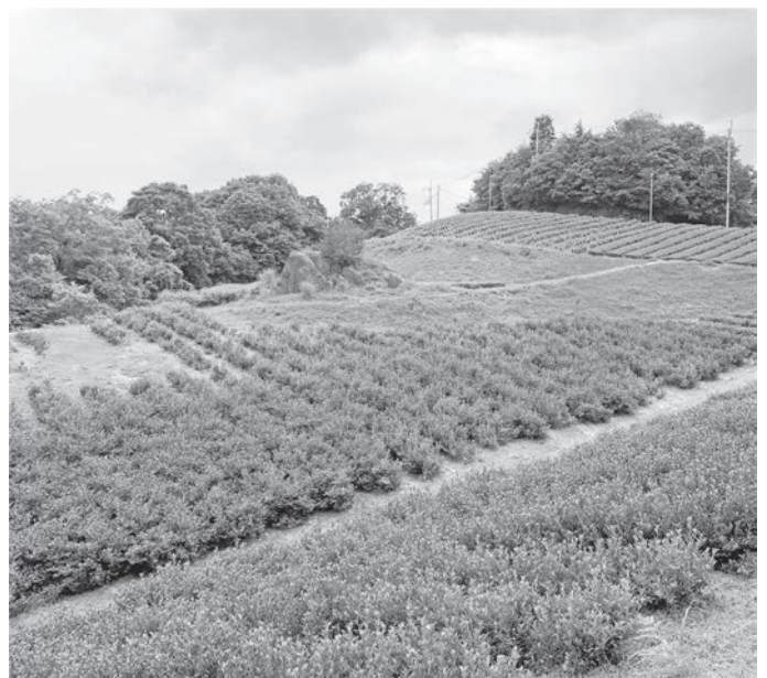
改植が進む茶畑 (田山)

A 村長 南山城村が全国で17番目、京都府では1番目に消滅する可能性がある。人口減少問題は依然として深刻な状況であり、「子育て応援対策」等、若者の転出超過抑制と地元定着の促進を図り、交流人口、関係人口を定住へ導く「定住促進施策」を進める。