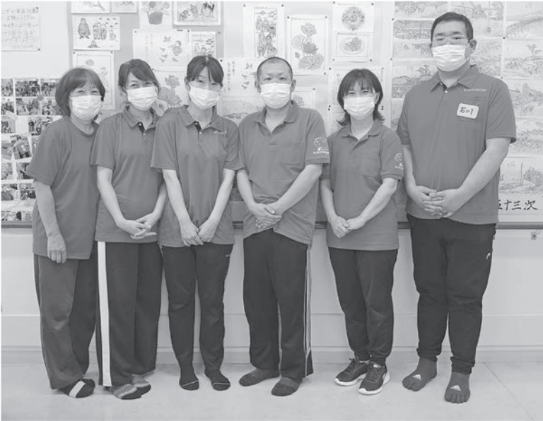
村の福祉を担うスタッフ（社協）

Q 令和5年度の当初予算の進入路整備事業が、もうまる1年がたとうとして、現在の所、予算1億5700万円の約2割し