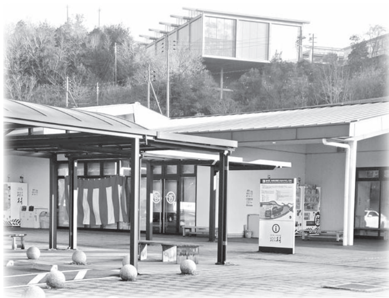
ふれあい交流施設(道の駅)

協力隊の業務で使用する。公用車全体の逼迫度は課として関知はしてないが、活動に必要なのでリースとして借りる。3か月という短期間での契約という方法もあるとは考えている。