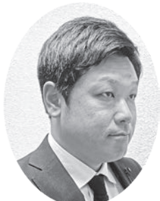
と き た ろ う 議員 土岐太郎

Q 議会や委員会等の公的な場で事実と異なる情報を発言し、これを記録に残す場合、虚偽公文書作成罪(刑法第156条)に該当する可能性がある。令和6年第3回定例会で、村長は外国人雇用の予定はないと述べたが、「のぼり藤」が村に提出した特別養護老人ホーム整備計画書の中で外国人技能実習生6名を採用する計画が載っているが、