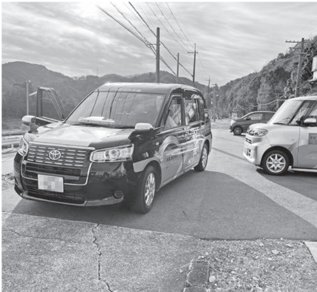
村タク土日の運行を（大河原駅）