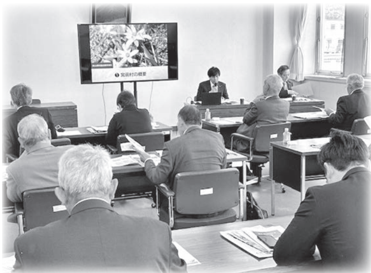
村づくり基本条例などの研修を受ける（長野県宮田村）

察研修に行きました。54kmと南山城村より少し小さな宮田村で、標高650mと野殿童仙房より高い位置に街が開けている。1956年に宮田村として現在に至る。地