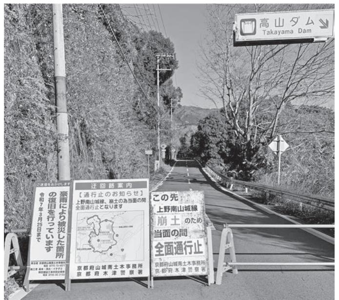
復旧が待たれる上野南山城線

Q 府道上野南山城線(82号)は現在通行止めになっているが、一日も早い復旧開通が待たれる村として進捗状況を把握しているのか。