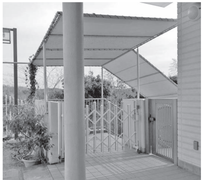
保育園にセキュリティを（南山城保育園）