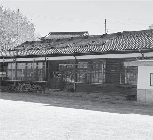
修繕が待たれる田山生涯学習センター

Q 各生涯学習センターの建物やグラウンド、元少年自然の家、各公園の遊具などの管理や点検はできているのか。 また、村としてこのような施設を今後どの様に考えているのか。 A 村長 日常的な管理