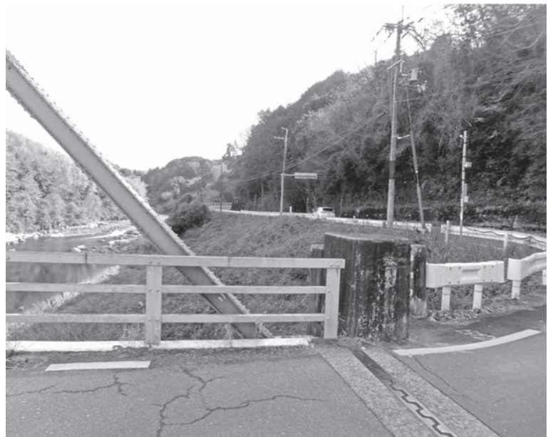
笹瀬橋南詰から田山地域を望む

段であって目的ではない。「これは山城南土木事務所長がいつも言われていることである。