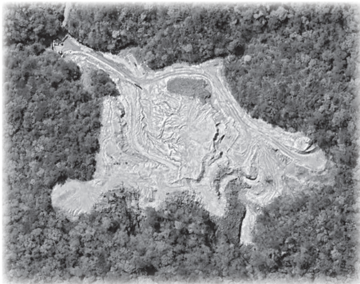
野殿・野口にある違法開発とみられる行為地 不法投棄による水質汚染が懸念される