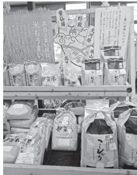
昨年の1.5倍の新米価格

A 村長 村民の物価高騰の現状は深く理解している。一般財源の支援は厳しいが、今回、生活者