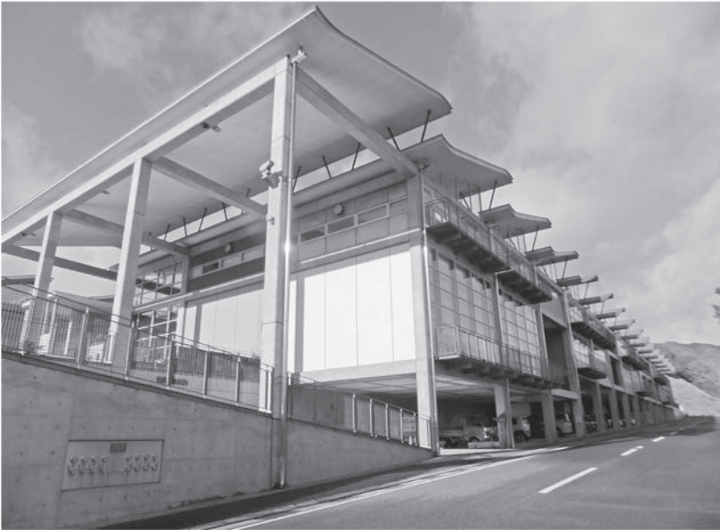
小学校の統合は（南山城小学校）

Q 現在の笠置中学校は、昭和24年に当時の笠置中学校・大河原中学校・高山中学校を統合し、組合立笠置中学校として運営