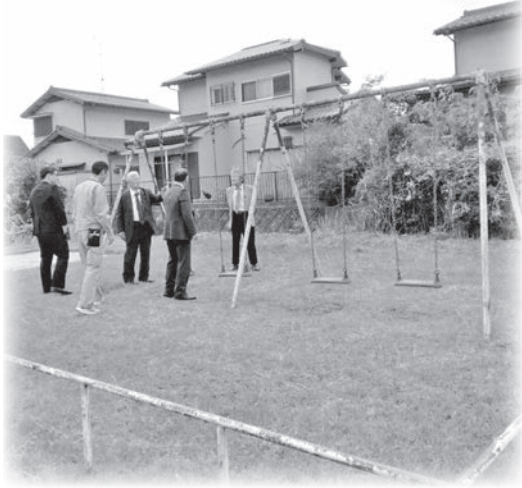
ニュータウン北公園見学