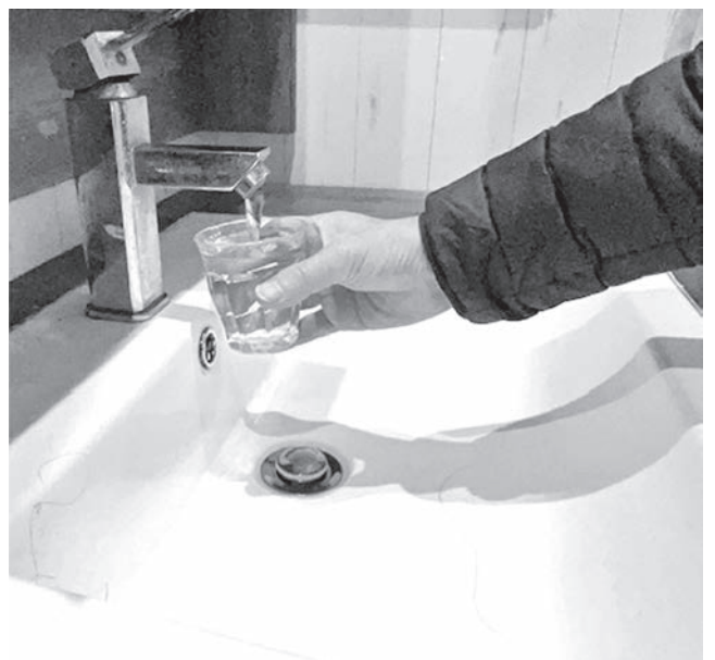
全国の水道からPFASが検出

Sの基準値超過に対する答えは、環境省の公表では基準値は50ng/lであり、本村の水道水は基準値を超過したことはない。