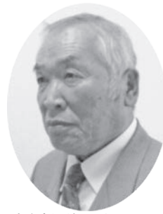
議員 次 契 徳谷

一般質問は事務の執行状況、将来の方針などの所信や疑問をただし、政治責任を明確にし、結果として、「現行の政策変更や新規政策を採択」させる効果があります。 また、村長には議員の質問に対する反問権を付与しています。 原稿は本人から提出されたものです。