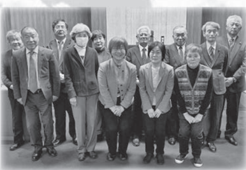
意見書依頼者と村会議員

昭和54年(1979年)国連はあらゆる分野で女性が性に基づく差別を受けない権利と平等の権利を保障する女性差別撤廃条約を採択し、日本は昭和60年(1985年)、この条約を批准した。令和6年(2024年)現在、条約批准189カ国中115カ国が批准しているが日本はまだこれを批准していない。 議定書を批准することにより、締約国は国際的な人権基準に基づき女性の人権侵害の救済と人権の保障をより強化できる。