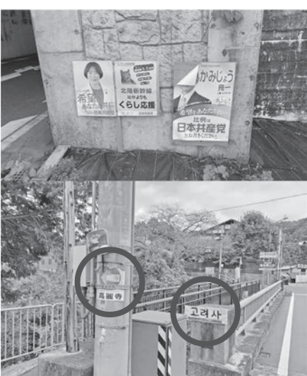
【違法屋外広告物】 京都府屋外広告物条例第3条2項違反明確な条例違反を放置し、取り締まられない平沼村政には疑問を感じざるを得ない

③令和6年度補正予算 ⑥常任委員会報告 ⑦一般質問・徳谷 ⑨一般質問・頭鬼 ⑪一般質問・齋藤 ⑬一般質問・土岐 ⑮議会報告会・研修