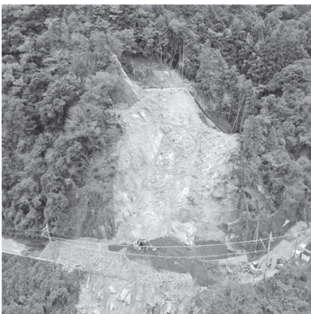
11月末時点の府道82号線 (南大河原)

また、う回路となっている村道については、準備を進めていて、工事発注の見通しは、令和7年春ごろになる予定。