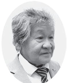
お 久 雄 議員 お 鬼 久 雄 議員

Q 村長はこれまで、特養と社協との、福祉サービスは重ならないようにしていくと答弁してきた。