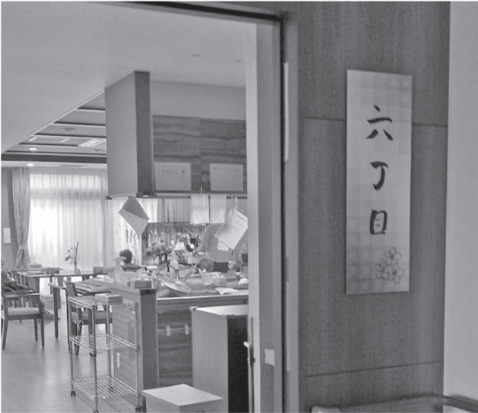
特養施設の内部（山添村）

Q 村内の施設で人間関係が切れることなく暮らせる喜びの一方、利用料を心配する声もある。村人が入れる特養になるのか。利用料は。