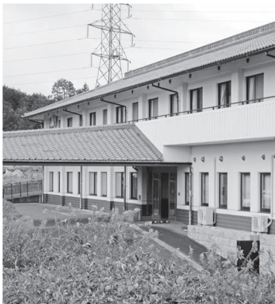
月ヶ瀬香梅園 (奈良市)

Q 特別養護老人ホームが村にできると介護保険料が値上がりするののか。 A 村長 村に特養ができて介護保険料は値上がりしない。