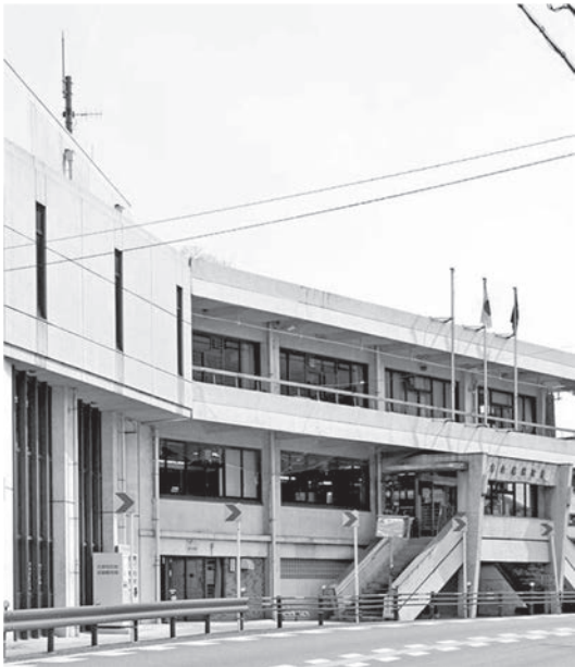
問われる 行政力（南山城村）

Q 全国自治体経営ランキング2023では、南山城村は全国1741団体の中で1687位になっている。近隣の市町・