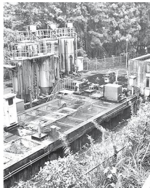
中央簡易水道施設 (山城谷)