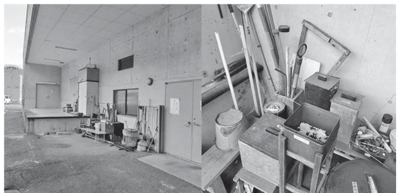
やまなみホール／裏