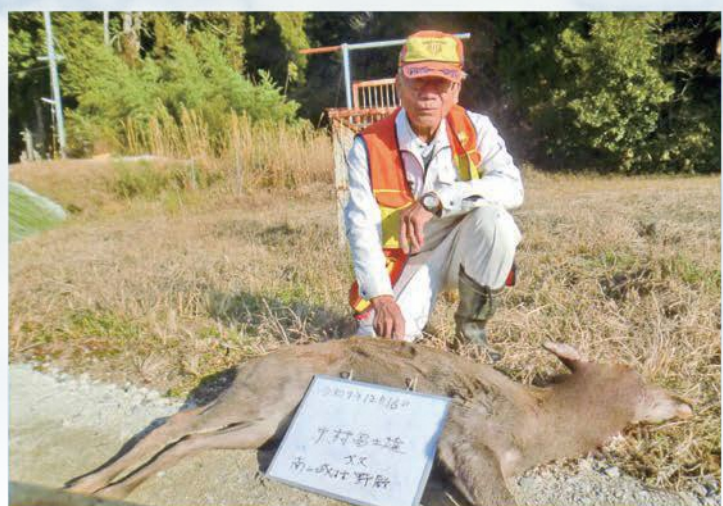
シカ捕獲強化事業による鹿捕獲 令和7年12月

4月から始まる「有害鳥獣駆除」を行う他、一年を通じて、地域のパトリール・情報収集等を行っています。 有害鳥獣駆除活動、本年度はイノシシ47頭、鹿147頭、アライグマ41匹、アナグマ17匹、ハクビシン6匹、鳥等3羽となっています。