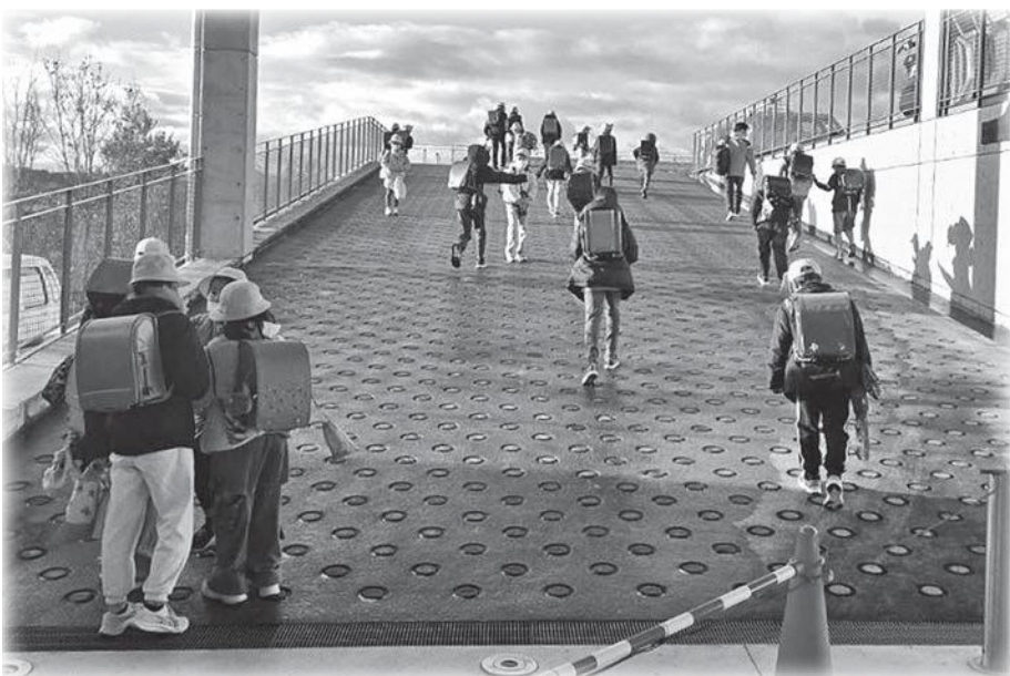
子どもたちに応援手当(南山城小学校)