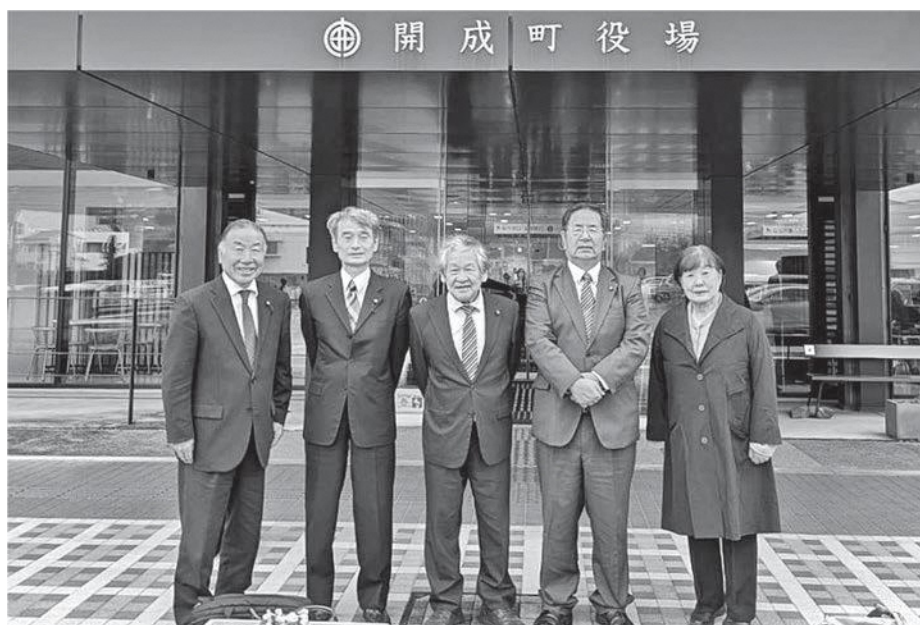
南山城村広報委員会

の両輪で、一人でも多くの町民に手に取ってもらいたいと信念を持ち発行。令和3年8月1日発行の広報がコンクールで奨励賞を受賞。令和4年5月からタブロイド判に変更され、令和5年から新たな取組みとして、「キッ