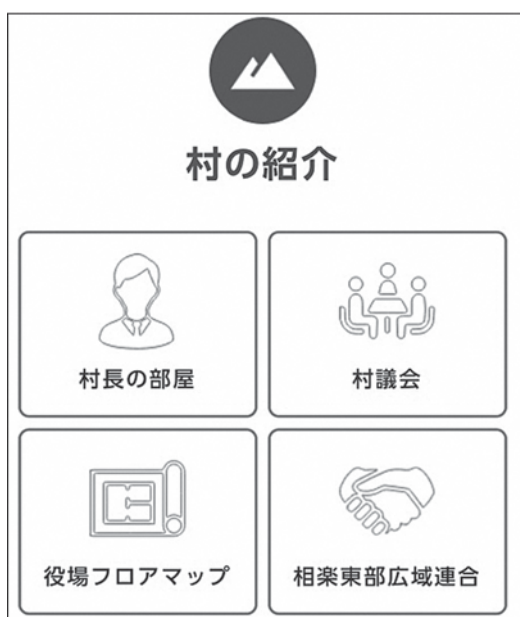
南山城村のホームページ