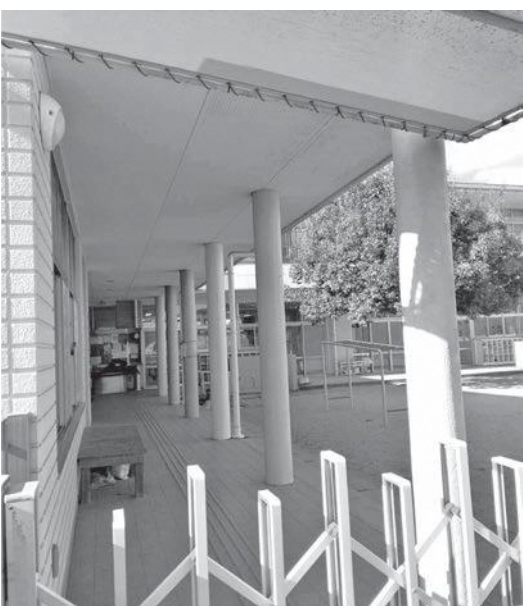
防犯工事が始まる保育園

Q 保育園型、幼保連携型の特徴は。 A 村長 保育園型は長時間保育の機能を活かし、就学前教育に幼稚園的な内容を追加。幼保連携型は教育と保育が一体化した総合的なカリキュラムで提供。 Q 子ども・子育て計画の「質の高い保育」とは。 A 村長 子どもの発達を支える環境、個性を尊重、保護者との連携、専門性の高い保育士、遊び Q 保育予算を増やし、撤去された大型遊具の代替えを。 A 村長 遊具の新規設置を来年度当初予算に計上する。 Q 緊急時の対策は。 A 村長 毎月の避難訓練、「110番非常通報装置」を12月中旬に設置。 Q 防犯カメラの設置状況は。 A 村長 1月中旬には屋外監視カメラ5台設置。 Q や生活を通して教育と保育の統合。