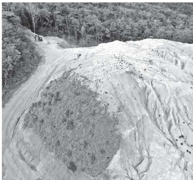
野殿地域の違法開発の爪痕