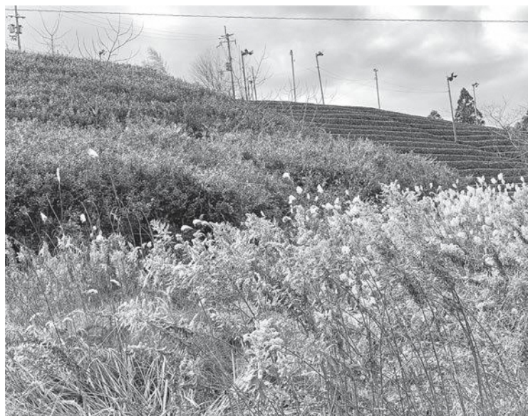
広がりつづける村の耕作放棄地