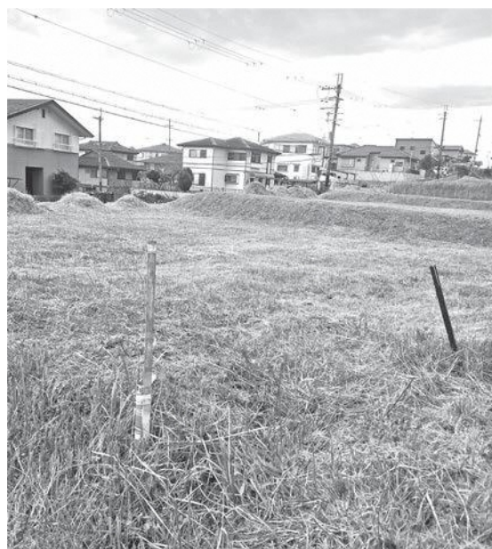
草刈りが終わった空地（ニュータウン）