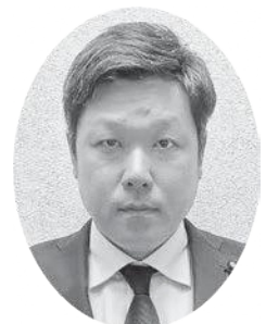
と き た ろ う 議員 土岐太郎 議員