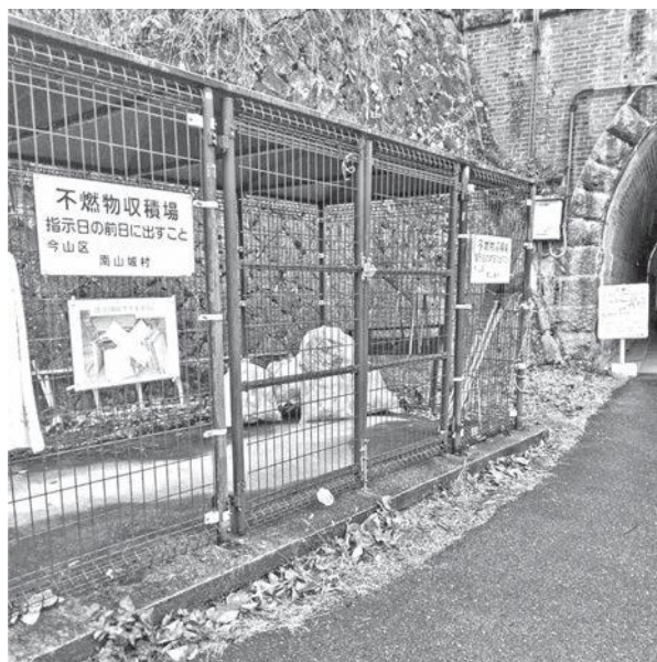
プラごみなどの集積場（今山）

Q 4市町村でのごみ処理広域化の中間案パブコメの結果や方向性の住民説明が必要だと思うが、どうか。 A 村長 1月の基本構想検討委員会での協議の後、公開は2月頃を予定。住民の理解を得ることは重要で説明をする。