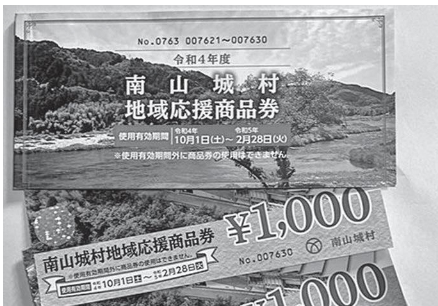
以前配布された商品券

Q 国は「おこめ券」の配布や、重点支援地方交付金を大幅に積み増しされ、すべての自治体で活