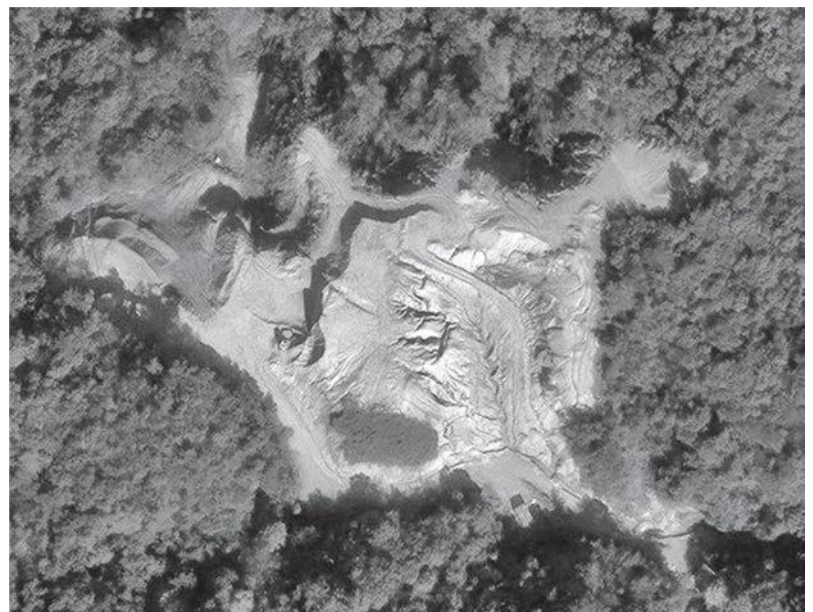
無断開発されている野殿地区

付を10月10日までに「弁明書を出せ」と申し入れたが出てこなかった。10月14日正式に、中止命令を出した。