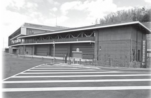
運用間近な相楽中部消防本部