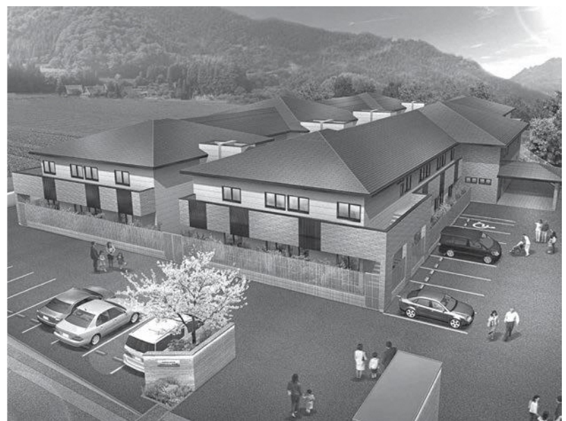
完成が待たれる特養ホーム（今山）