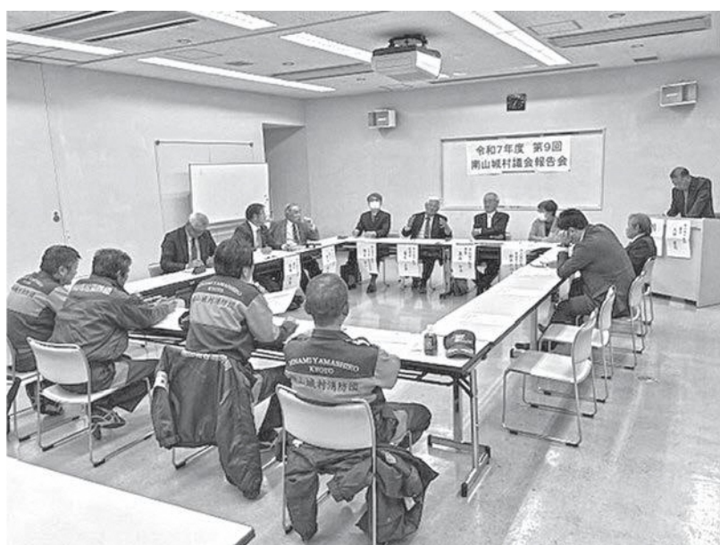
消防団の悩みがよくわかった報告会