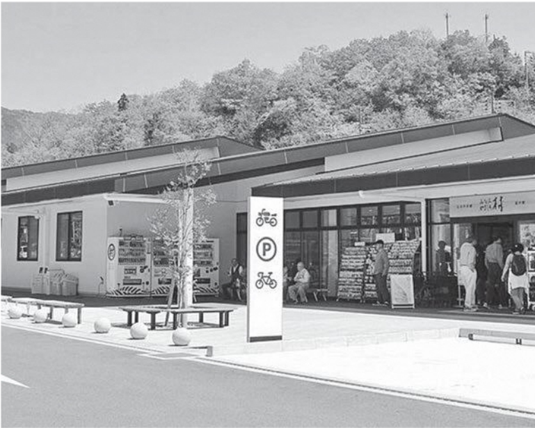
観光入込み客数が増えている道の駅（道の駅）